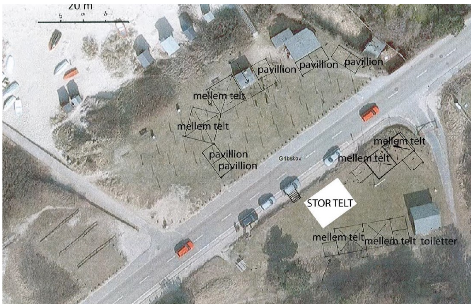
Figur 2: Teltenes placering på arealet.