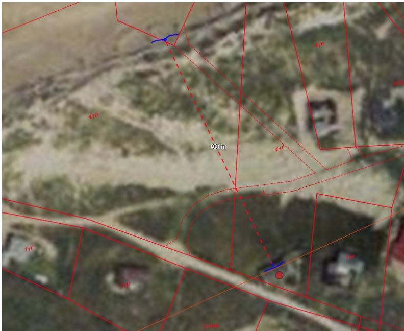
1995 luftfoto med opmåling af linjen.

For ansøgers ejendom har det klitfredede område således i dag en dybde på ca. 85 m – og i 1995 lå linjen ca. 100 m fra den inderste strandbred/landvegetationen.