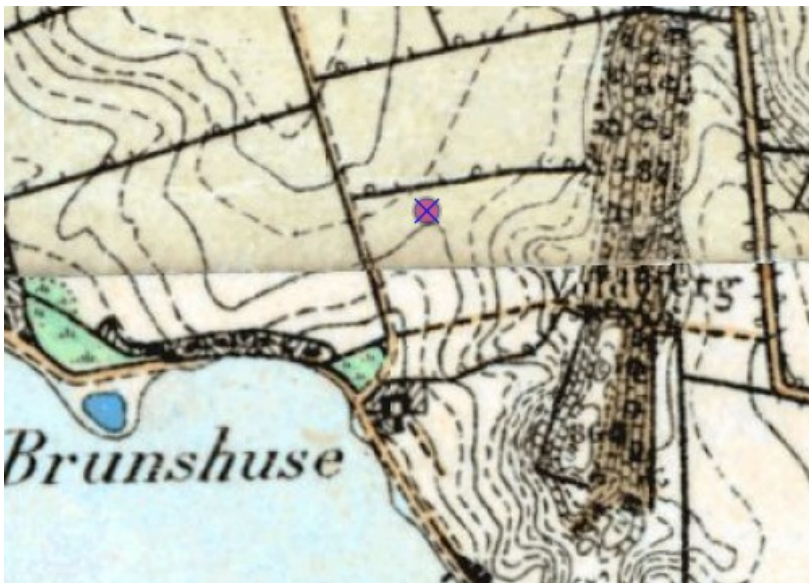
Målebordsblad – høje – 1842-1899 – ejendommen vist med markering