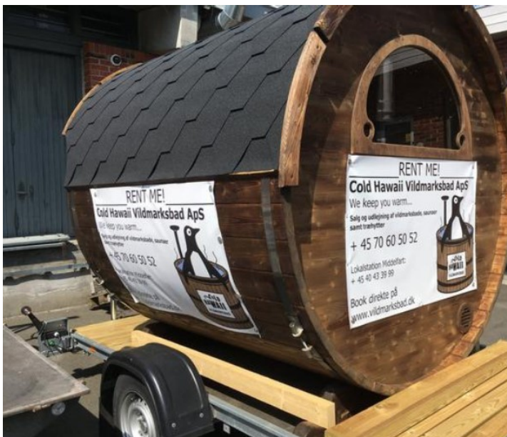
Figur 3. Foto fra ansøgningen, der viser eksempel på mobilsauna.

Saunavognen, vinterbadeklubben har i tankerne, har følgende ca. størrelse: Længde udv. 300 cm Diameter 250 cm Plads til 7 til 8 personer. Se figur 3.