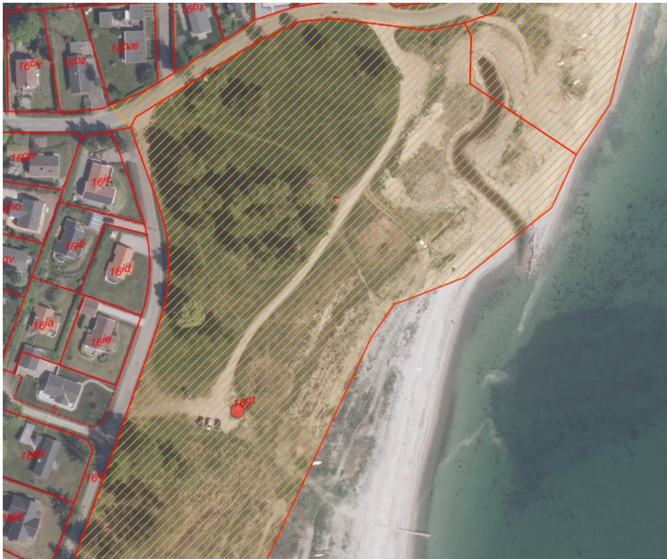
Figur 2. Luftfoto – sommer 2018. Orange skravering markerer strandbeskyttelseslinjen.

Saunavognen, vinterbadeklubben har i tankerne, har følgende ca. størrelse: Længde udv. 300 cm Diameter 250 cm Plads til 7 til 8 personer. Se figur 3.