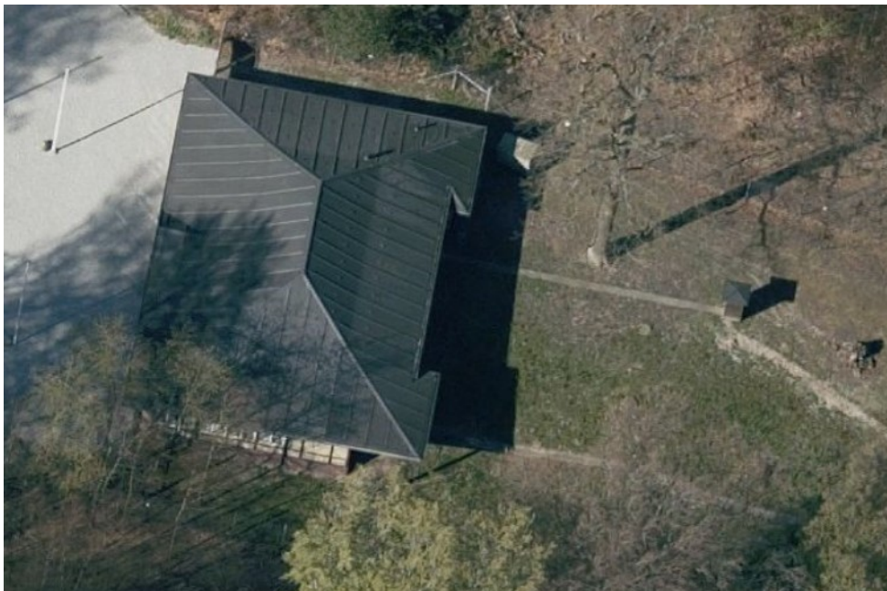
Luftfoto af bygningen. Udvidelsen i stueplan sker under det eksisterende halvtag, som ses nederst til højre. Kælderen etableres til højre for bygningen.