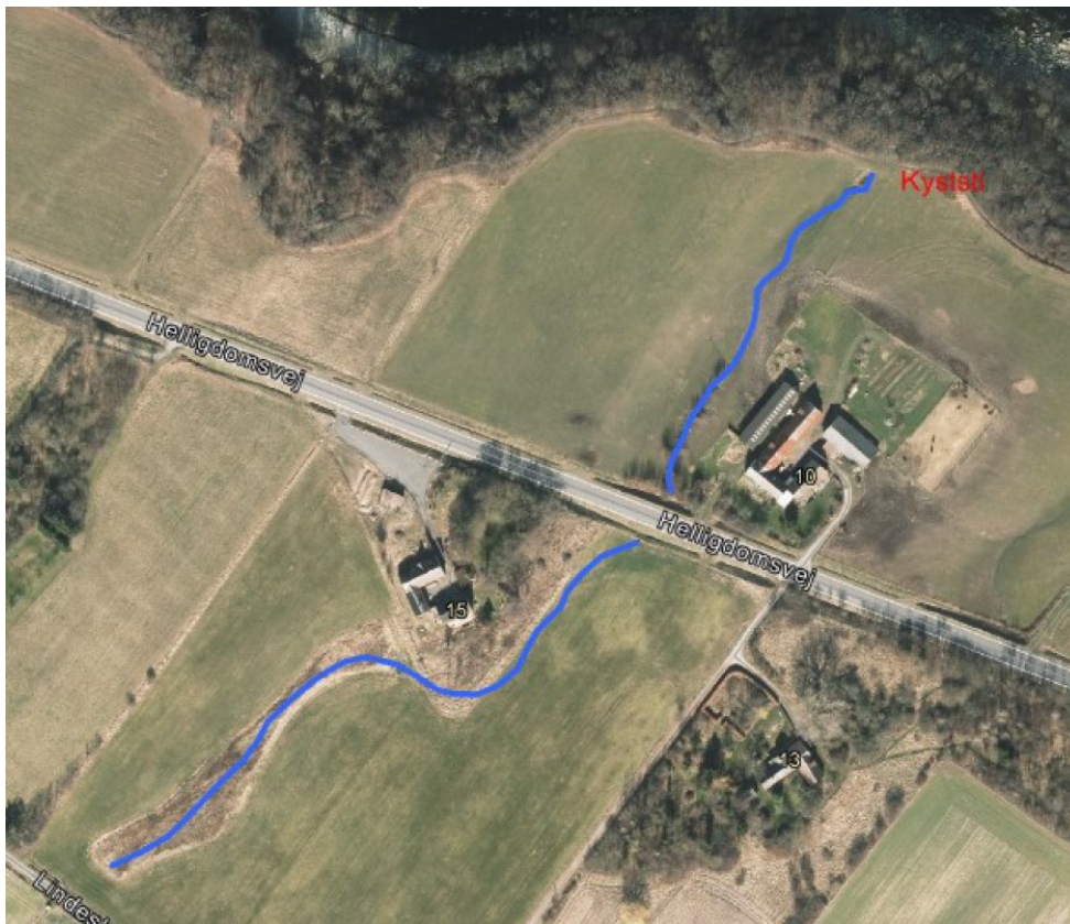
Åbning af vandløb – gældende dispensation