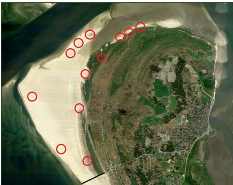
Fig. 2. Kort der viser hvor der traditionelt har ynglet hvidbrystet præstekrave og dværgterne de senere år (røde cirkler).

Området er en del af Nationalpark Vadehavet og omfattet af natur- og vildtreservat Vadehavet.