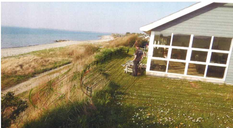
Visualisering af terrassen samt opfyldning af terræn v. hjørnet