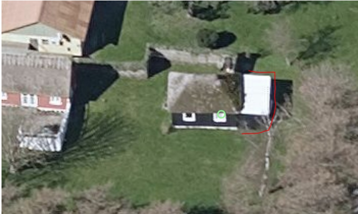
Eksisterende skur markeret med rød