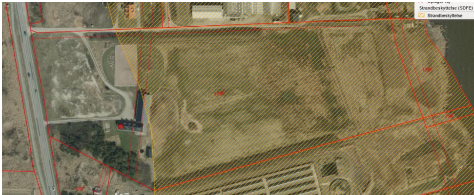
Figur 1. Luftfoto – sommer 2018. Orange skravering markerer strandbeskyttelseslinjen. Rød streg markerer matrikelskel.

Der ansøges dispensation fra strandbeskyttelseslinjen til opførelse af ny ridehal på 16 m x 45 m i forbindelse med hestehold – se figur 2 og 3.