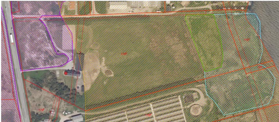
Figur 4. Luftfoto – sommer 2018. Orange skravering markerer strandbeskyttelseslinjen. Grøn skravering markerer eng, lyseblå skravering markerer strandeng og lilla skravering markerer hede.