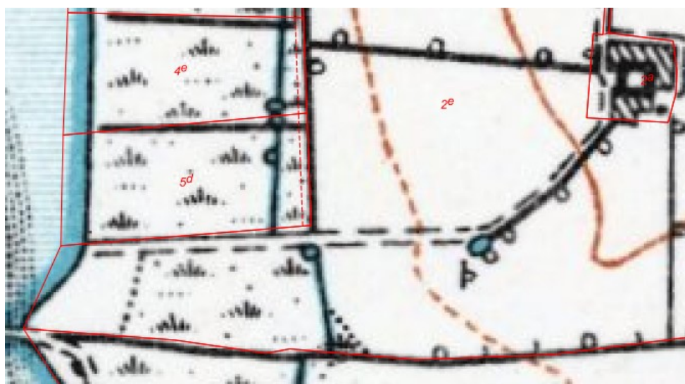
Fig. 4. Lave målebordsplade 1928-1940, der viser, at der tidligere har været en sø med samme størrelse og placering som den nuværende på ca. 100 m 2 .

Der er på matriklen registreret et beskyttet sten- og jorddige og §3 beskyttet strandeng (Naturbeskyttelsesloven).