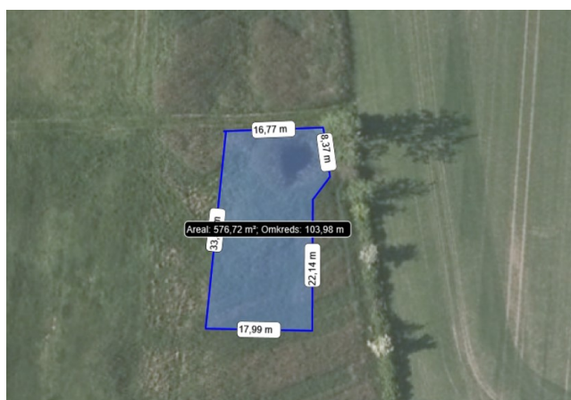
Fig. 2. Kort der viser udvidelsen af søen i forhold til den eksisterende sø.