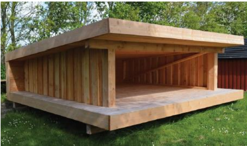
Referencebillede. Shelteret vil fremstå i en mørkere farve, da det behandles med træbjære.