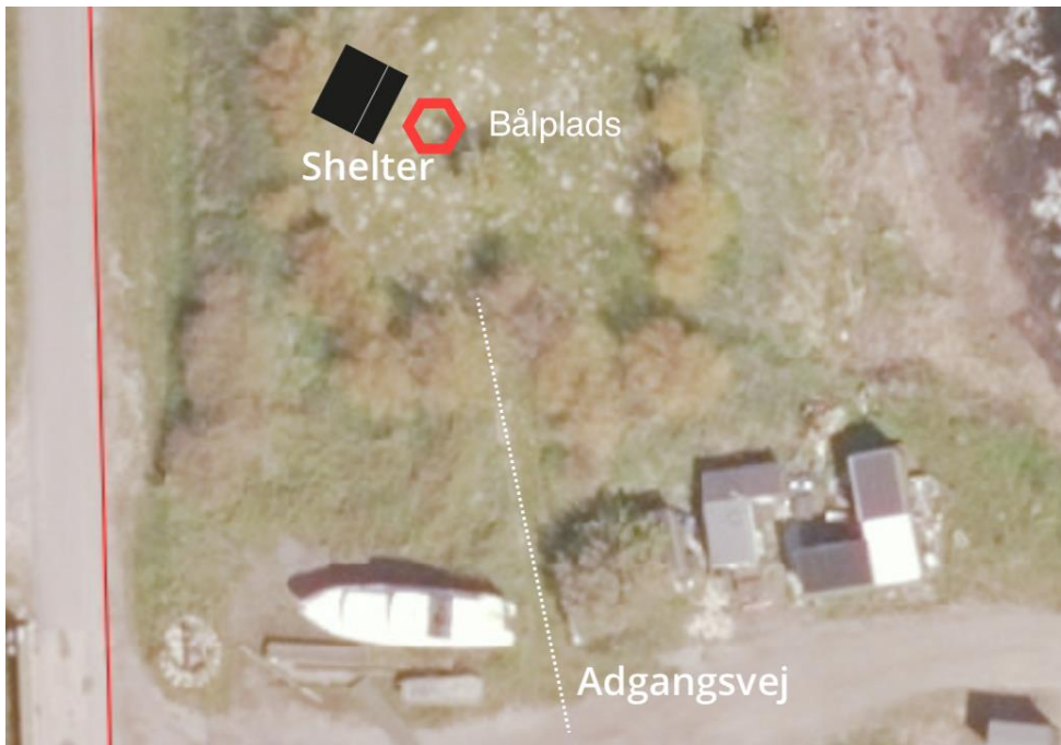
Fig. 2. Detailkort over placeringen af de ansøgte faciliteter – shelter og båtplads.

Ifølge ansøgningen vil den ansøgte shelterplads være åben for offentligheden og målrettet mange forskellige typer af brugere såsom kajakroere, cykellister og vandrere.