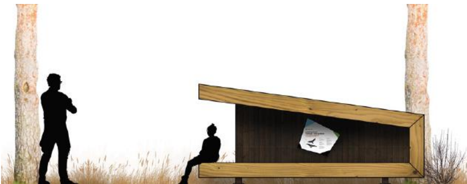
Shelter efter Naturstyrelsens sheltermodel 1.7.

Materialer og overflader udføres i træ, og shelteret vil i sin helhed fremstå i naturfarver. Shelteret etableres på fundamentsten, således en mindst mulig fundering opnås. Såfremt at shelteret senere skal fjernes, så efterlader en simpel fundering ingen varige spor.