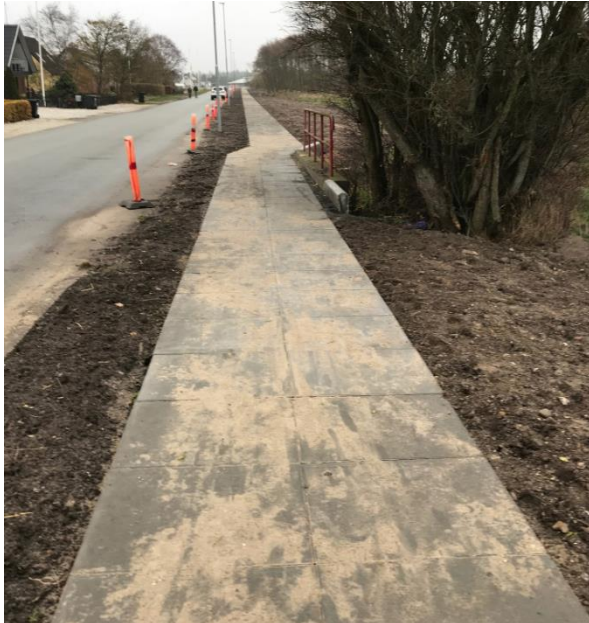
Eksempel, der viser typen af fortovsfliser, der søges om. Indsat fra ansøgningen

Den del af stien, som ansøgningen vedrører, er anlagt på private ejendomme. Stien er udlagt som offentlig sti i lokalplan fra januar 2000. Der er indhentet accept fra lodsejerne til projektet.