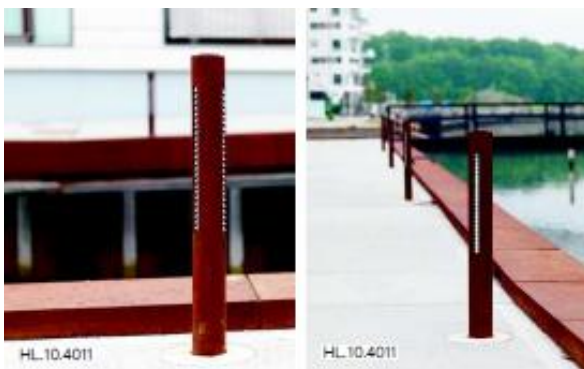
Eksempel på pullertlampe. Indsat fra ansøgningen

Ejendommen ligger ca. 7,2km fra Natura 2000-område nr.16 (habitatområde nr. 16, fuglebeskyttelsesområde nr. 12), jf. bekendtgørelse nr. 1595 af 6. december 2018 om udpegning og administration af internationale naturbeskyttelsesområder samt beskyttelse af visse arter.