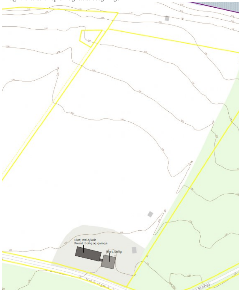
Situationsplan, der viser bygningernes placering på ejendommen.