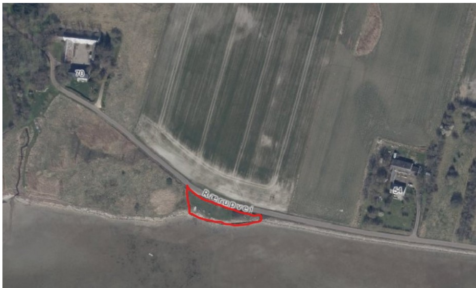
Fig. 2. Oversigtskort af arealet og placering i forhold til Rærupvej 54 og 70. Rødt område indikere det rekreative areal.