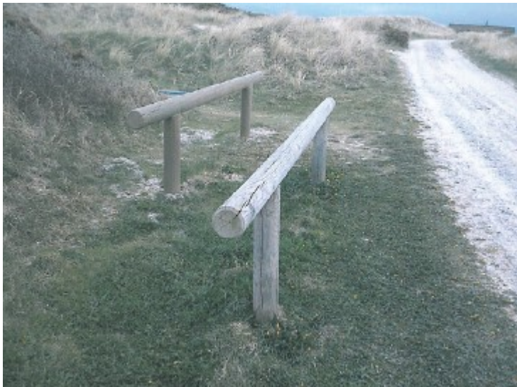
Fig. 4. Eksempel på cykelstativ.

Der er registreret §3-beskyttet strandeng (Naturbeskyttelsesloven) vest for arealet, men ikke selve pladsen.