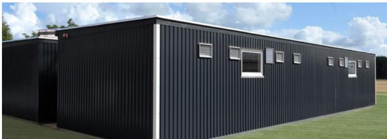
Fig. 5. Billedeksempel på en klimapavillon.