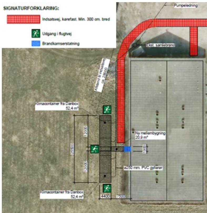
Fig. 2. Situationsplan viser placering af de to klimapavilloner (sort stribet firkanter) ved siden af den eksisterende stald.