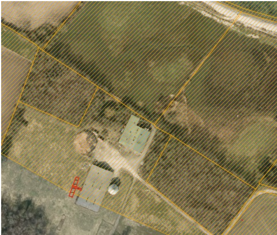
Fig. 1. Område inden for strandbeskyttelseslinjen (orange skavering) ved husdyrbruget. Den røde polygon markerer placering af de nye klimapavilloner.

Ansøger oplyser at den valgte placering af klimapavillonerne er den mest optimale i forhold til driften på ejendommen, da pavillonerne kan tilbygges en tværgang i den eksisterende stald (BBR bygning 6). Det vil ikke være muligt at opføre pavillonerne syd for stalden, som ligger uden for strandbeskyttelseslinjen, da de langsgående gange i stalden ikke vil være velegnet til at forbinde pavillonerne til. En placering på den østlige side af stalden er ikke mulig på grund af placeringen af en stor kornsilo.