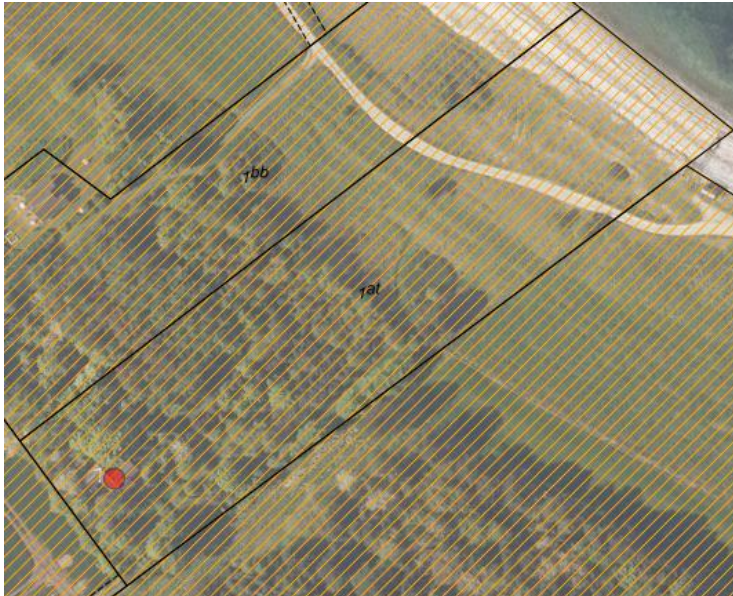
Fig. Ortofoto 2018. Den røde prik markerer sommerhuset. Det orange skraverede markerer det strandbeskyttede område. De sorte streger markerer matrikelskel.

I forbindelse med genopførelsen af sommerhuset ønskes der etableret et nyt nedsivningsanlæg på matriklen (se fig. 1.).