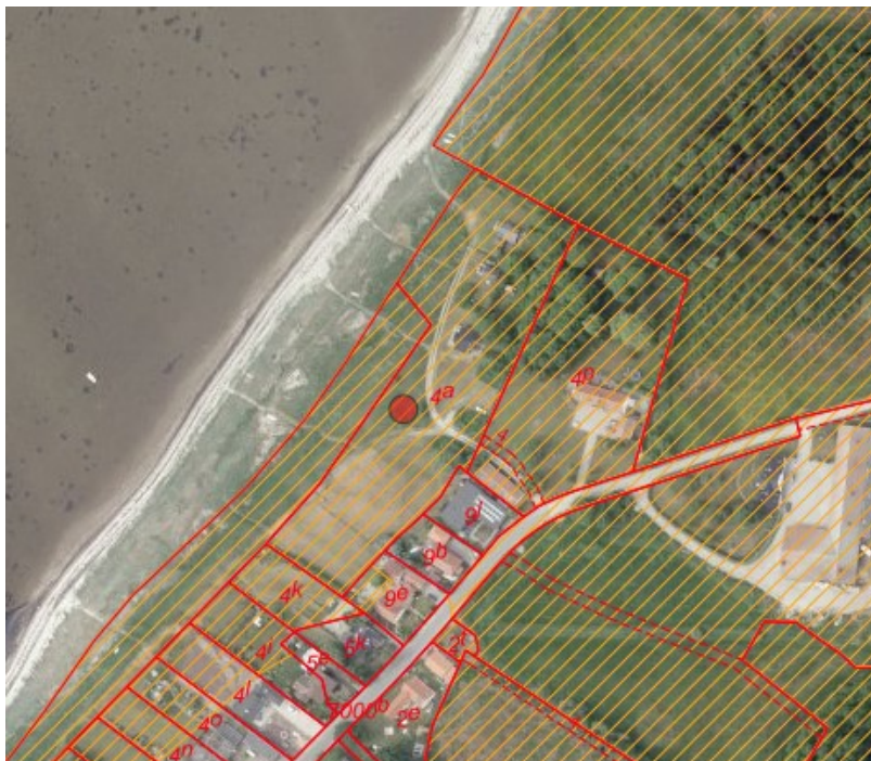
Strandbeskyttelseslinjens beliggenhed på området