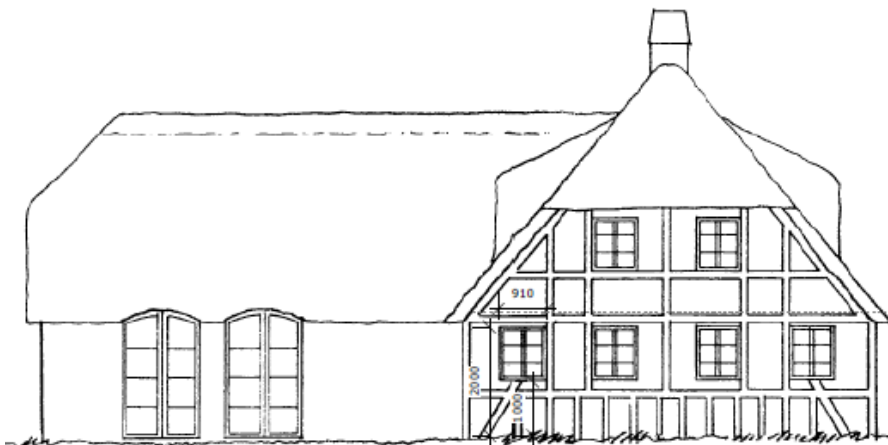
Tegning der viser den eksisterende facade mod øst. Indsendt af ansøger