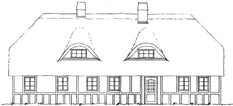
Tegning der viser den eksisterende facade mod nord. Indsendt af ansøger.