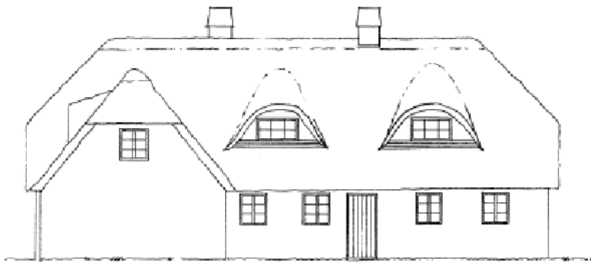
Tegning der viser den eksisterende facade mod syd. Indsendt af ansøger.