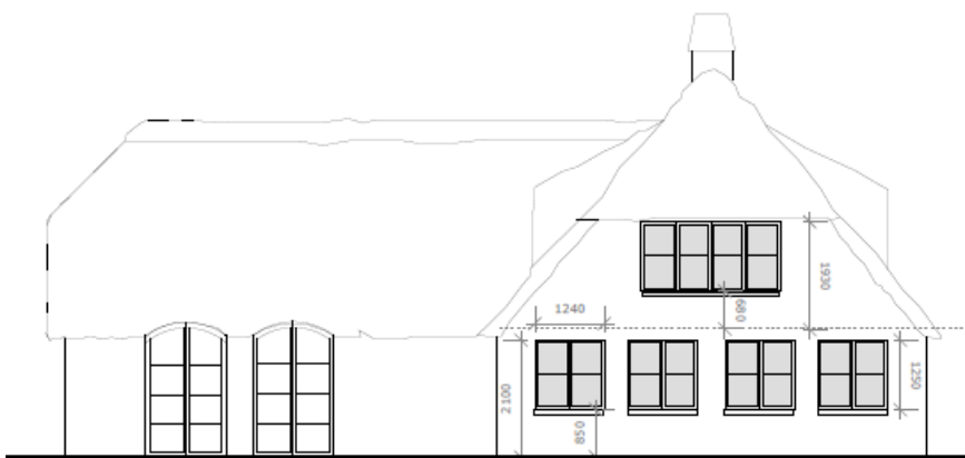
Tegning der viser den nye facade mod øst. Indsendt af ansøger.

Ejendommen er beliggende i til Natura 2000-område nr. 56 (habitatområde nr. 52, fuglebeskyttelsesområde nr. 36 og ramsar område nr. 13), jf. bekendtgørelse nr. 1595 af 6. december 2018 om udpegning og administration af internationale naturbeskyttelsesområder samt beskyttelse af visse arter.