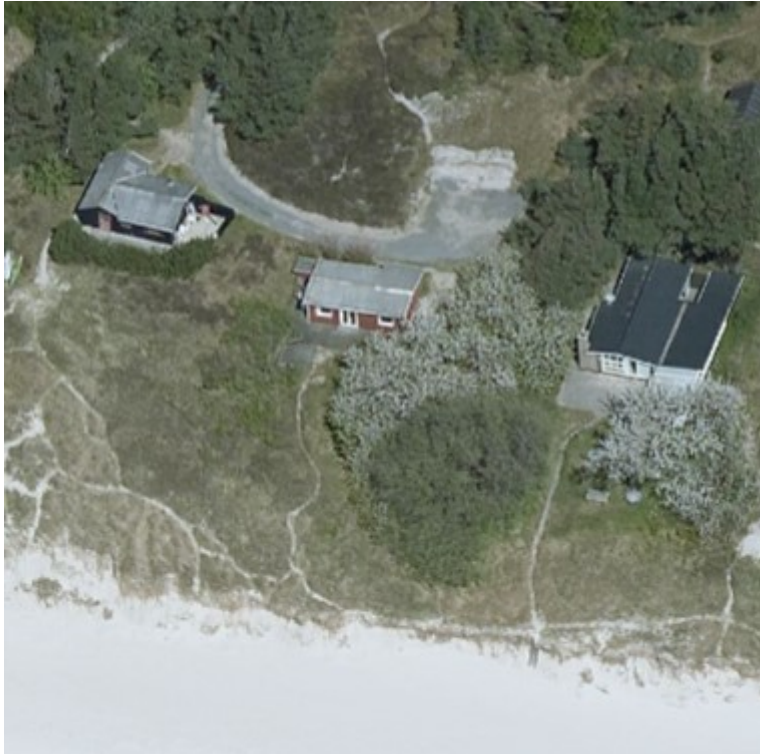
Skråfoto fra maj 2017, sommerhuset ses midt i billedet med rødmalet facade

2017 vejledt ejeren af sommerhuset, ansøger, om at der uden dispensation kan opføres et skur på op til maksimalt 10 m 2 uden dispensation jf. naturbeskyttelseslovens § 15a stk. 3.