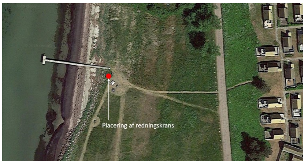
Fig. 1. Placering af redningskrans ved Gedser Feriepark matr. nr. 211 Gedesby By, Gedesby.

På fig. 3 ses den forventede redningskrans, den forventes at blive 2,2 m høj.