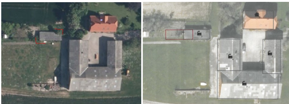
Bygning der fjernes markeret med rød – placering af ansøgt bygning

Ejendommen er beliggende i/op til Natura 2000-område nr. 173 - Smålandsfarvandet nord for Lolland, Guldborg Sund, Bøtø Nor og Hyllekrog-Rødsand (habitatområde nr. 152, fuglebeskyttelsesområde nr. 85), jf. bekendtgørelse nr. 1595 af 6. december 2018 om udpegning og administration af internationale naturbeskyttelsesområder samt beskyttelse af visse arter.