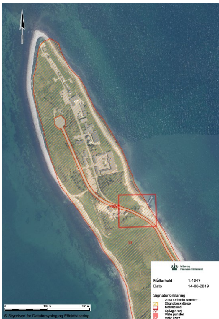
Fig. 1. Oversigtskort over matrikel 33 Yderby By, Odde. Rød firkant indikere placering af erstatningsbygning og kortet på fig. 2.