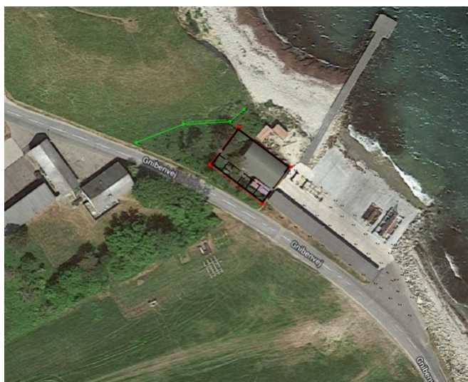
Fig. 2. Oversigtskort af området, halvtag, telthal og placeringen af erstatningsbygning (sort/rød firkant). Grøn linje indikerer grænsen til §3 beskyttet overdrev (Naturbeskyttelsesloven).