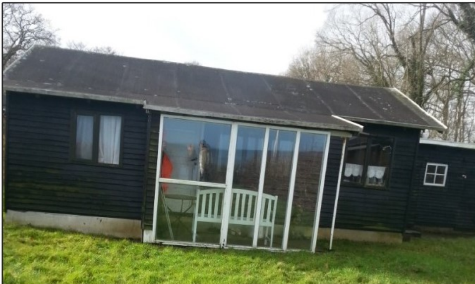
Foto af udestue/overdækket terrasse. Fotoet er taget ved en besigtigelse, som Naturstyrelsen foretog i forbindelse med behandlingen af sagen om lovliggørelse. Indsat fra NST-4132-510-00158.

Grundplan af sommerhuset, som ejeren har indsendt. Udestuen/terrassen ses som en del af huset. Det skraverede område øverst er den søgte udvidelse. Indsat fra ansøgningen.