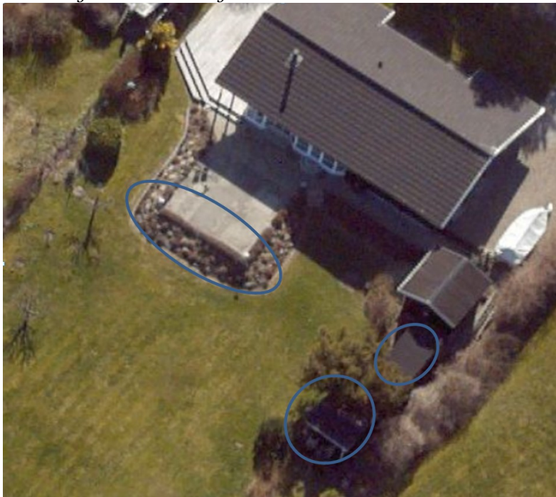
Foto 1 (Energi-, Forsynings- og Klimaministeriets skråfoto, 25.3.2017) – To skure/overdækninger samt hævet terrasseanlæg (se blå markeringer).