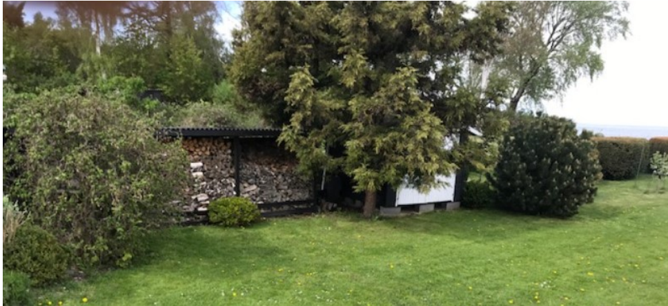
Foto af de to skure vedlagt svaret på partshøring

Ejer har oplyst det andet skur til at være på 9m 2 , hvilket passer med Kystdirektoratets vurdering. Dette skur vurderes at ligge lige udenfor 15m af beboelsen.