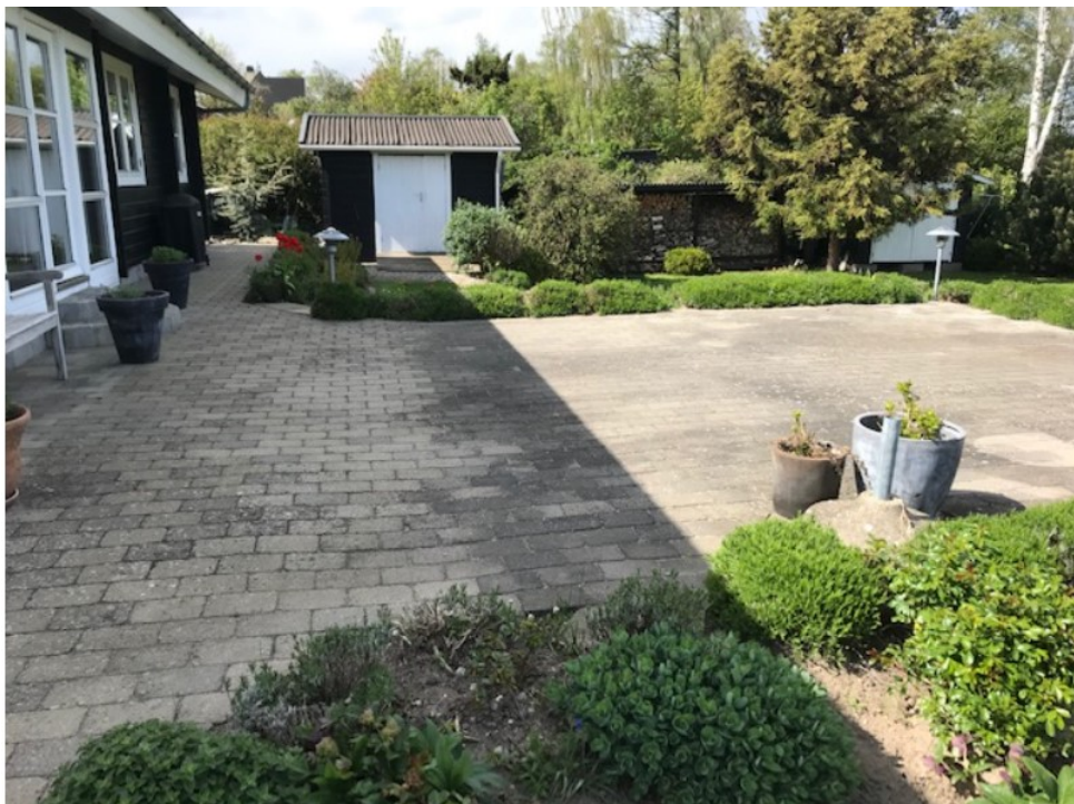
Foto af terrassen vedlagt svaret på partshøring

2014, ortofoto, den udvidede terrasse ligger 3m indenfor strandbeskyttelseslinjen – det samlede anlæg 6m indenfor strandbeskyttelseslinjen