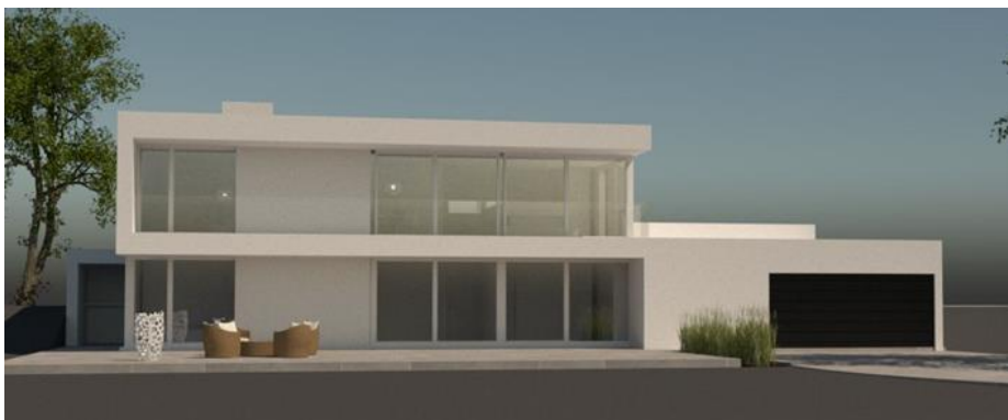
Billede der viser det ønskede hus.