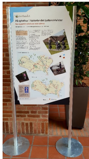
Modelprøve – uden jordanker