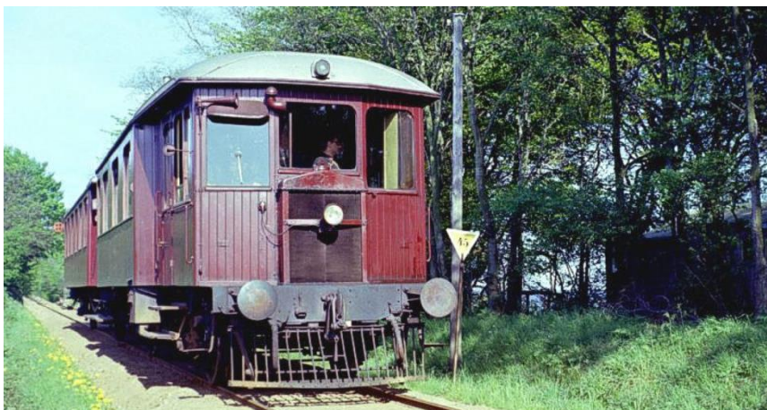
Figur 1: HOJ, Lm 415 og C 423, Strandskoven – Husodde, 23. maj 1965.

Med partshøringssvarerne er der indsendt et billede fra 1965, hvor hytten ses og i den forbindelse redegøre ansøger for forholdene.