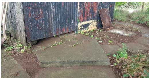
Foto medsendt partshøringsvaret., der viser at en del af hytten er placeret oven på en fast betonbelægning.

Det fremgår dog tydeligt, at den er udført i materialer og i en kvalitet, der røber, at den i sin tid er udført af professionelle håndværkere. Langs trappen løber et metalgelænder. Udformningen af gelænderet viser, at det er konstrueret specifikt til trappen. Gelænderet har lige som huset oprindeligt været malet den klassiske ”jernbane-røde” farve. Placeringen af trappen nær jernbanen, den direkte adgang til stranden, den professionelt udseende konstruktion, gelænderets udformning, farve og kvalitet mv. indikerer, at trappen har været etableret med henblik på officielt offentlig brug. Som tidligere i historien fungerer trappen i dag som offentlig adgangsvej til stranden.