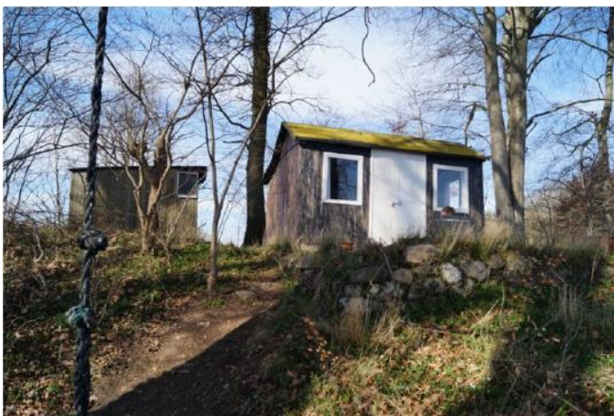
Foto fra besigtigelsen, der viser stenene.

Ved besigtigelsen blev der konstateret sten nedenfor terrassen. Kystdirektoratet vurderer der er tale om en støttemur.