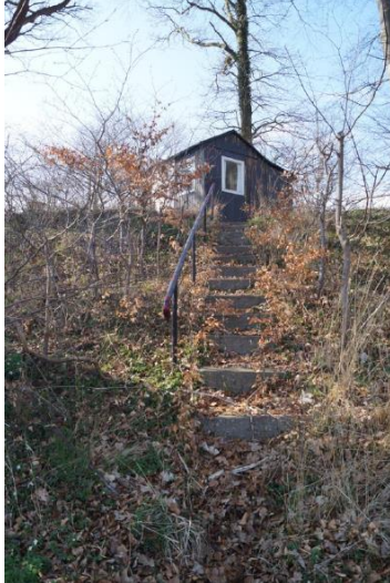
Foto fra besigtigelsen, der viser trappen.

Der blev ved besigtigelsen konstateret en trappe, der går fra østsiden af hytten og ned til den offentlige sti.