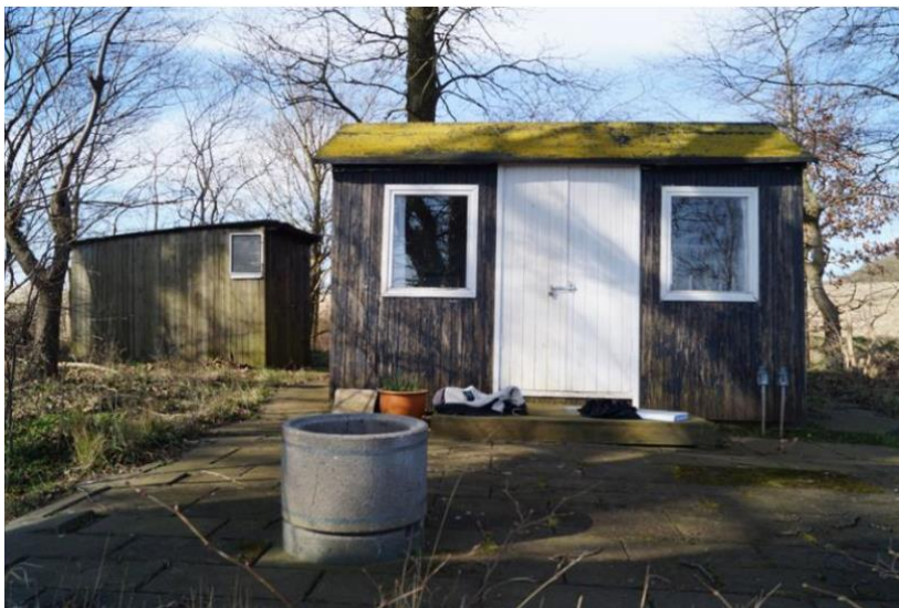
Foto fra besigtigelsen i 2017, der viser hytten.

Med partshøringssvarerne er der indsendt et billede fra 1965, hvor hytten ses og i den forbindelse redegøre ansøger for forholdene.