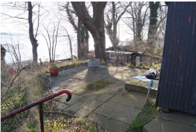
Foto fra besigtigelsen, der viser terrassen.

Grundet terrassens placering og kvaliteten af luftfoto, er det ikke muligt at dokumentere opførelsesåret, men der har sandsynligvis været etableret terrasse i en eller anden størrelse og form samtidig med hyttens opførelse, se luftfoto 1965.