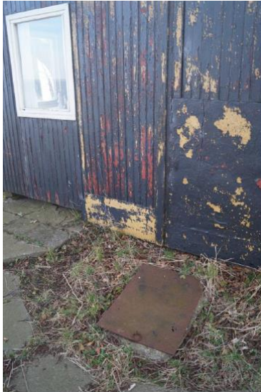
Foto fra besigtigelsen, der viser hullet med låget.

I forbindelse med besigtigelsen, blev der øst for hytten konstateret et hul med et låg.