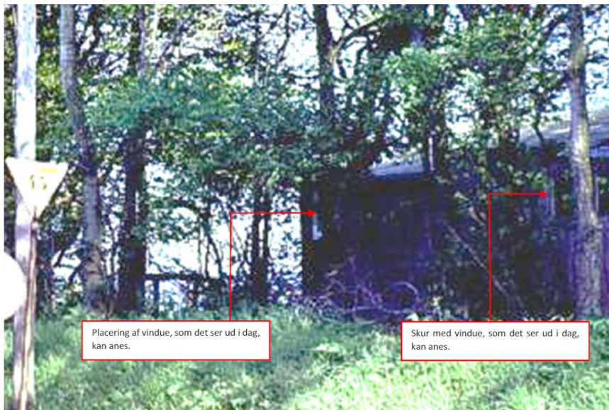
Figur 2: Nærbillede af en del af figur 1.

Ansøger skriver følgende: Selvom huset er det mindste i kolonien, er det tydeligt, at det som de fleste andre huse i bebyggelsen er fremkommet ved tilsyneladende tilfældig knopskydning. Af bl.a. spærkonstruktionen, gulbræddernes forskellighed, taghældning, vægmateriale mv. kan det aflæses, at den oprindelige bygning er udvidet to gange. Den del af bygningen, hvor der ud mod den tidligere jernbane er placeret et vindue (det vindue der ses på figur 2), vurderes at være den sidst tilkomne del af bygningen. På den baggrund kan det konkluderes, at billedet på figur 1 og 2 viser vores hus fuldt udbygget – svarende til den konstruktion vi kender i dag. Det kan dermed også dokumenteres, at vores hus og skur er fra før 1965.