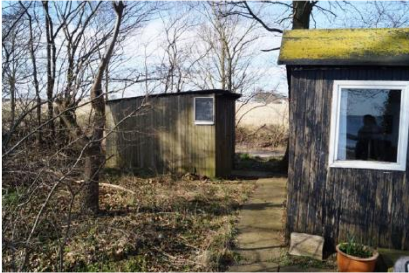
Foto fra besigtigelsen, der viser skuret.