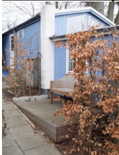
Foto fra besigtigelse 2017, der viser træterrasse vest for hytten.

Der er i forbindelse med partshøringen oplyst, at der ifølge gamle naboer altid har været en terrasse på dette sted ved huset. Det har ikke været muligt at finde fotos, der beviser dette. Træterrassen skulle være bygget hen over et gammelt betondæk, som man har brugt tidligere som terrasse. Ansøger mener en pæn træterrasse falder langt pænere ind i landskabet, frem for en støbt plade, så der anmodes om at denne må bibeholdes.