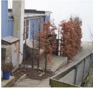
Foto fra besigtigelse 2017, der viser hækplanter vest for hytten.

I forbindelse med partshøringen er der oplyst, at: Jeg vil gerne ansøge om dispensation til at bibeholde ca 1,4 x 1 m af hækken ved enden af huset, da det skærmer af for udsyn til en grim vandbeholder, der står ved husets sydvestlige hjørne (1,4 meter ud fra huset, og 1 meter ned mod vandet, svarer til enden af huset). Samtidig vil det lille stykke hæk skærme af for niveauforskellen fra den offentlige sti ned imellem husene og vores sandterrasse, hvor der fra hækken imellem træterrassen og vores sandterrasse er et niveauforskel på ca 40 cm. Så jeg mener, at ved at bibeholde denne lille smule hæk, så kan der både undgås faldulykker og der afskærmes af for grim vandbeholder, som opsamler vand fra vores tag. Hækken nord for træterrassen fjernes, og 3,5 meter hæk fra kanten af huset og ned til vandet fjernes. Det bed der bliver efter hækken genetableres med siv.