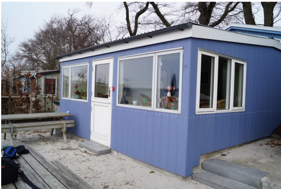
Foto fra besigtigelse 2017, der viser hytten med terrasse set fra sydøst.

I forbindelse med partshøringen er det oplyst, at det i forbindelse med huskøbet blev oplyst at hytten ligger på det sted hvor den første bebyggelse blev etableret i 1918. Den ældste modtagne dokumentation er dog et foto fra 1959, der viser en række flagstænger på en del af strækningen. Fotoet er indsat længere nede i afgørelsen.