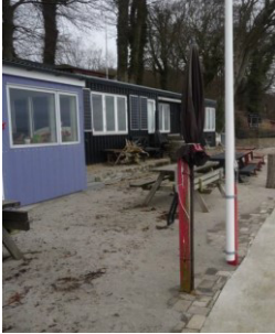
Foto fra besigtigelse 2017, der viser flagstang samt pæl fra tidligere flagstang. Denne pæl er sidenhen fjernet.

Ved besigtigelse 2017, blev der konstateret en flagstang placeret på kanten af terrassen mod vandet.