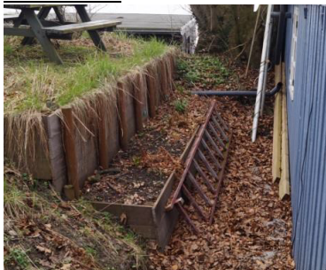
Foto fra besigtigelse 2017, der viser støttemure øst for hytten.