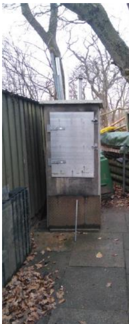
Foto fra besigtigelsen i 2017, der viser røgeovnen.

I partshøringssvaret oplyses det at rygeovnen er opført i 1986 og denne anvendes af flere af områdets brugere.