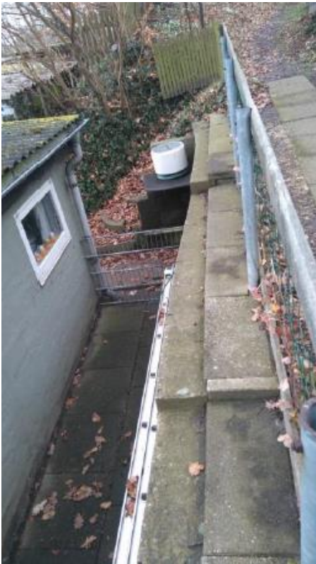
Foto fra besigtigelsen i 2017, der viser støttemuren bag hytten, set oppefra.

I partshøringssvaret fremgår det at støttemurerne er opført omkring 1968.