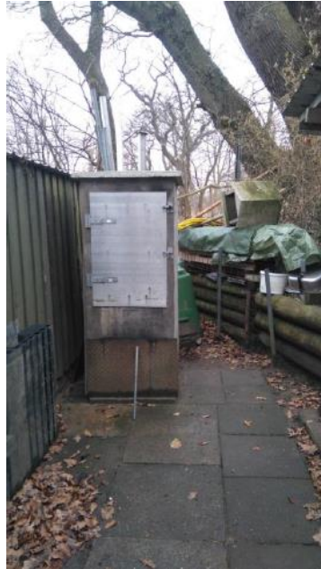
Foto fra besigtigelsen i 2017, der viser støttemuren bag skuret.