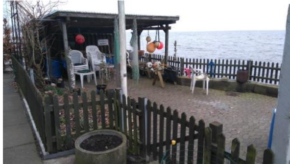
Foto fra besigtigelsen i 2017, der viser terrassen set både fra nordvest og nordøst.