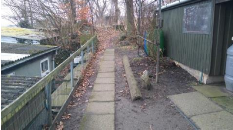
Foto fra besigtigelsen i 2017, der viser hegn nord for hytten.

Ved besigtigelsen blev der konstateret opsat hegn nord for hytten.