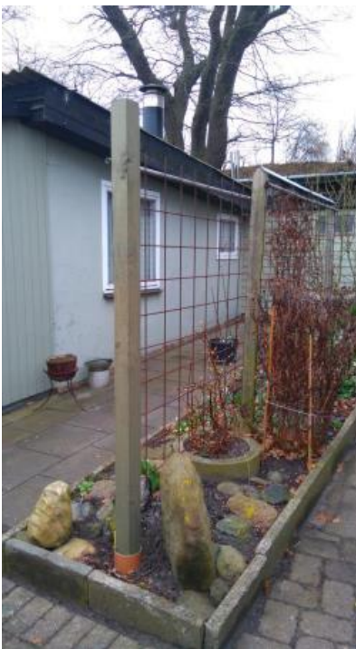
Foto fra besigtigelsen i 2017, der viser bedet med espalier, hvor espalieret er fjernet.

Af partshøringssvaret oplyses det at bedet med espalier er opført i 2007.