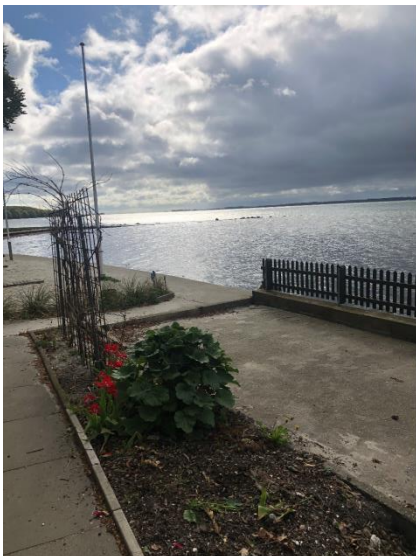
Foto indsendt i forbindelse med partshøringen, her ses en del af hegnet ud mod vandet.

Der i partshøringssvaret oplyst at hegnet er opført i 1986.