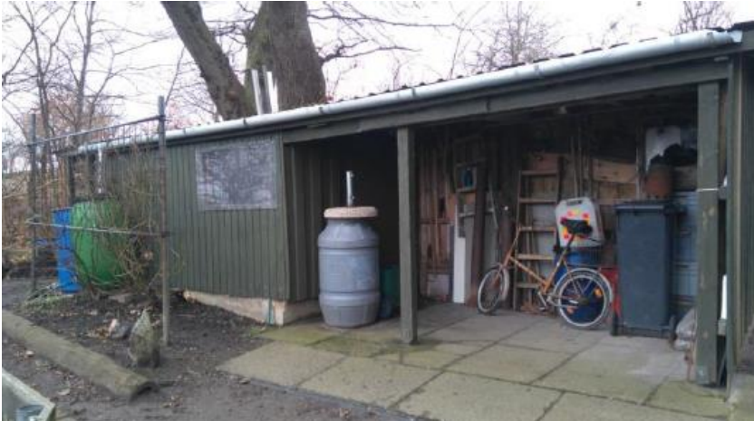
Foto fra besigtigelsen i 2017, der viser skuret set fra syd.