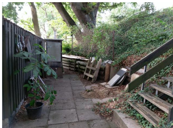
Foto fra partshøringssvaret, hvor røgeovnen ses.