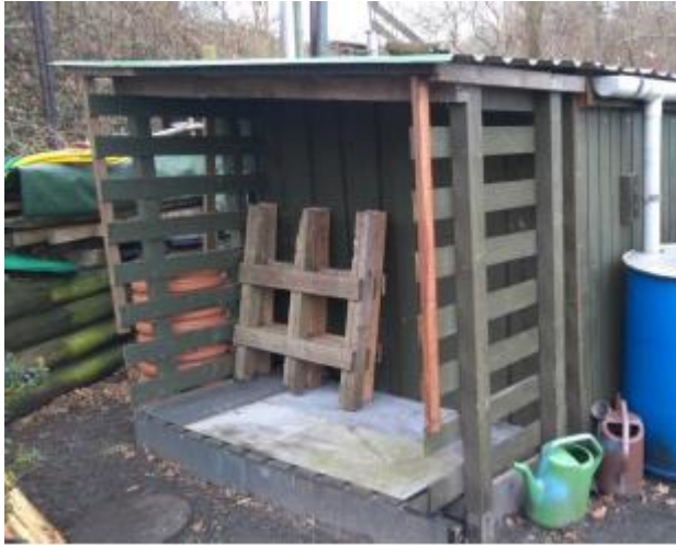
Foto fra besigtigelsen i 2017, der viser både det orange rør samt dækslet.

Der blev ved besigtigelsen konstateret et rør på bagsiden af rygeovnen samt et dæksel vest for skuret.