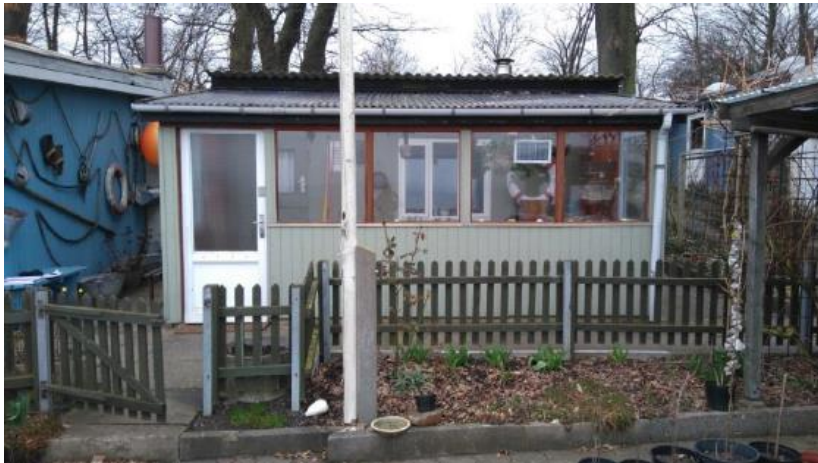
Foto fra besigtigelsen i 2017, der viser hytten set fra terrassen.