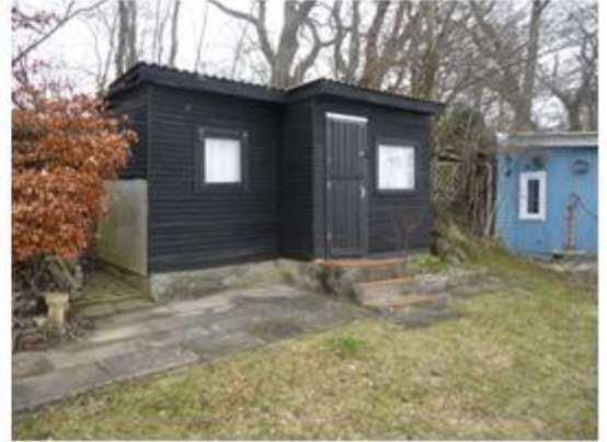
Foto fra besigtigelse 2017, der viser hytten, terrassen og skur til højre for hytten.

I forbindelse med partshøringen er det oplyst, at hytten er opført i 1939 på baggrund af en tilladelse fra det daværende Horsens Havneudvalg, der var ejer af arealet. Der foreligger ikke en dispensation fra daværende myndighed for strandbeskyttelseslinjen, Strandkommissionen.