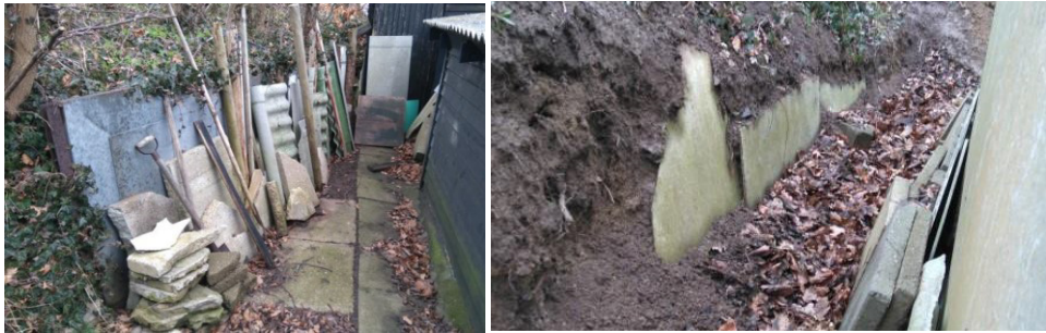
Foto fra besigtigelse 2017, der viser støttemur bag de to bygninger. Der ses endvidere en del oplag af diverse materialer.

Støttemurene er ifølge ansøger etableret i forbindelse med hyttens opførelse i 1930'erne.