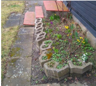
Foto fra besigtigelse 2017, der viser bed foran skuret.

I forbindelse med partshøringen er bedet beskrevet således: ”Vedr. det andet bed ved skuret, så beskytter det skuret ved højvande, der er ikke tale om et havebed.”