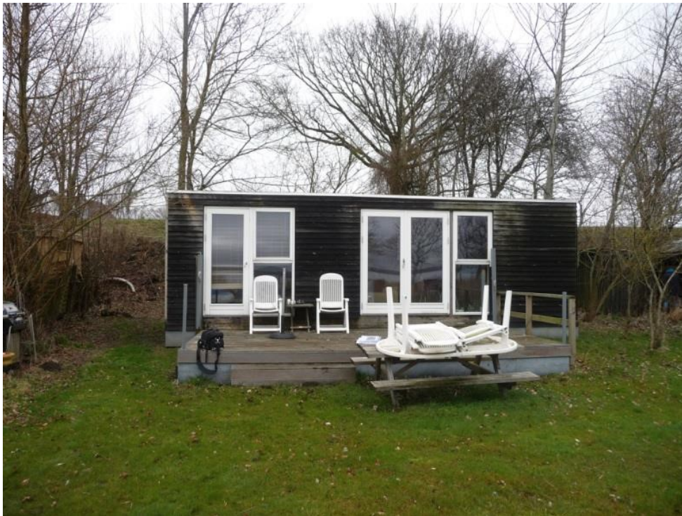
Foto fra besigtigelse 2017, der viser hytten, terrassen og skuret til højre bag hytten.