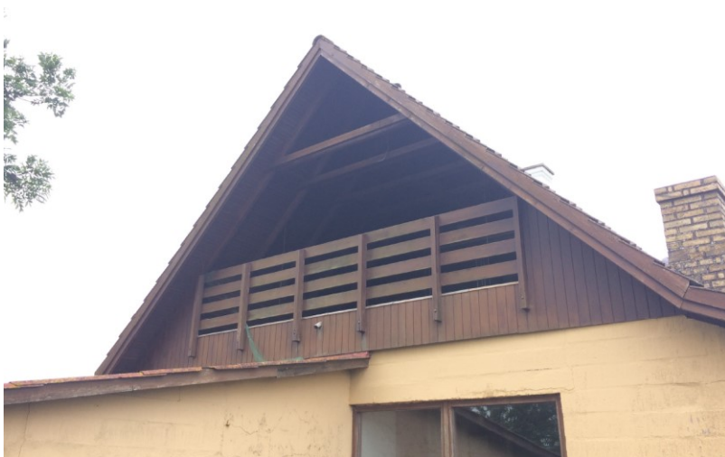
Billede af altan/svalegang udefra. Indsat fra ansøgningen.