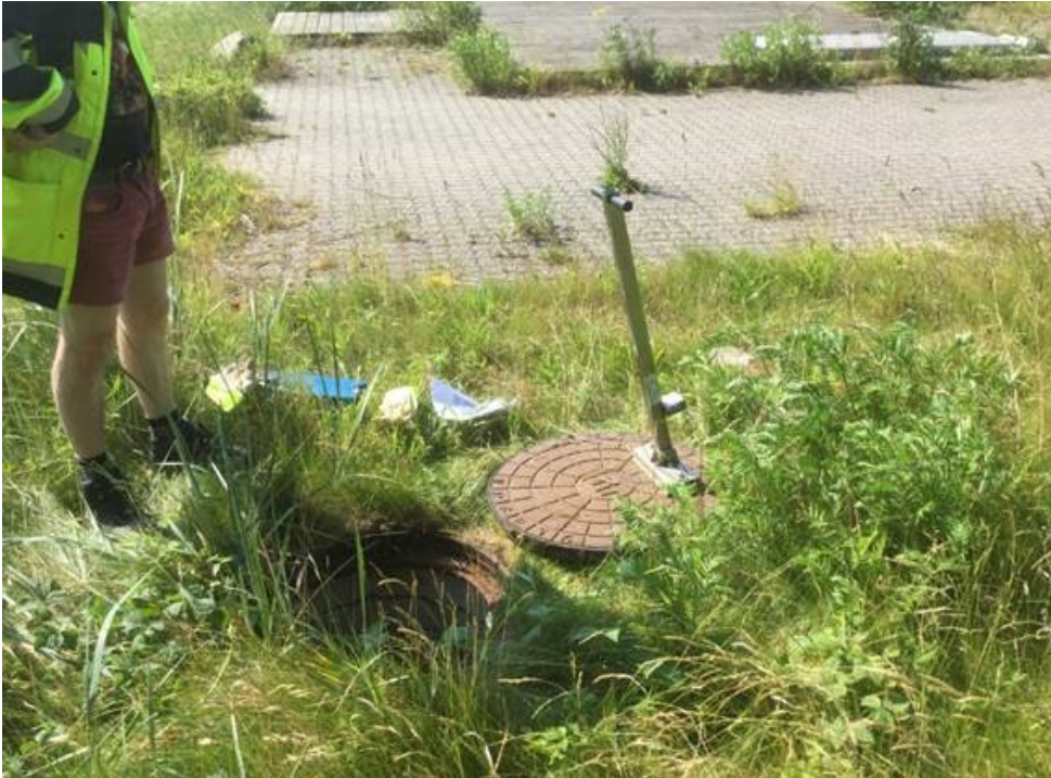
Figur 4. Eksisterende dæksel hvor imellem ny regnvandsledning etableres. Dæksler etableres på samme vis med en maksimumhøjde over terræn på 7 cm.

I forbindelse med nedgravning af regnvandsledning er der brug for et arbejdsareal, som Faxe Forsyning har beregnet til følgende arbejdsareal som fremgår af figur 5. Arealet er beregnet til 400 m 2 i en periode på 3 måneder.