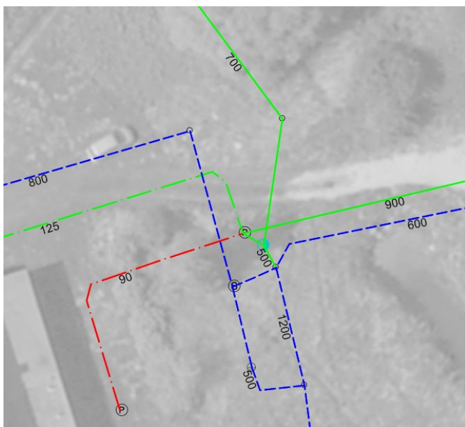
Figur 1. Oversigt over eksisterende kloakforhold ved pumpestationen.

I forbindelse med omlægningen etableres fire brønddæksler inden for strandbeskyttelseslinjen.