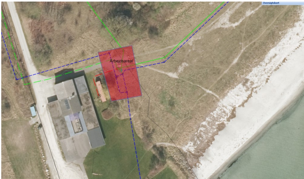
Figur 5. Arbejdsarealet mens arbejdet pågår.

I forbindelse med nedgravning af regnvandsledning er der brug for et arbejdsareal, som Faxe Forsyning har beregnet til følgende arbejdsareal som fremgår af figur 5. Arealet er beregnet til 400 m 2 i en periode på 3 måneder.