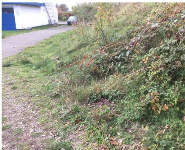
Figur 3. Eksisterende brønddæksel. De 4 nye brønddæksler er af samme fabrikat som eksisterende dæksler og etableres i samme højde fra terræn.