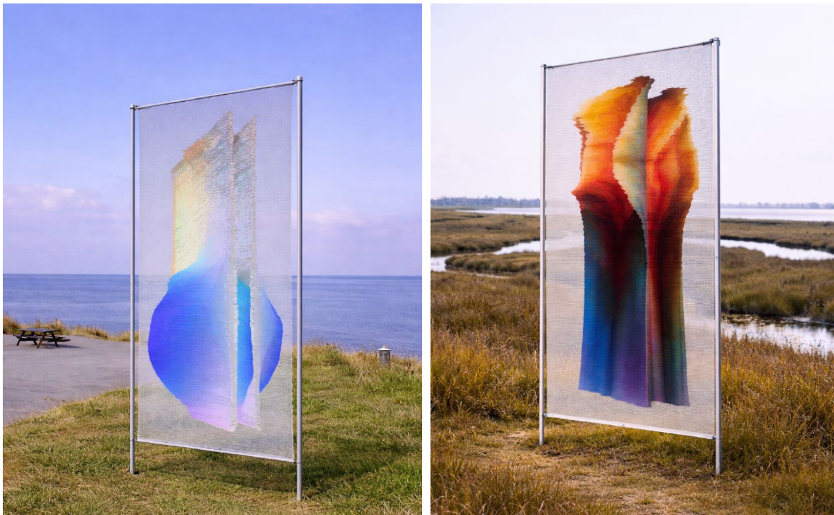
Figur 2. Billeder fra ansøgninger der viser eksempler på de ansøgte kunstværker.

Nedenstående billeder fra ansøgningen viser eksempler på de ansøgte kunstværker.