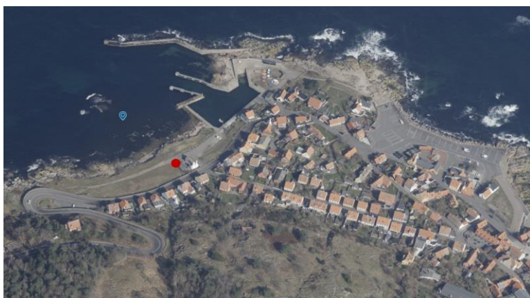
Fig. 2. Skråfoto af området fra 2023 hvorpå den ansøgte placering af teltet er markeret med rød prik.