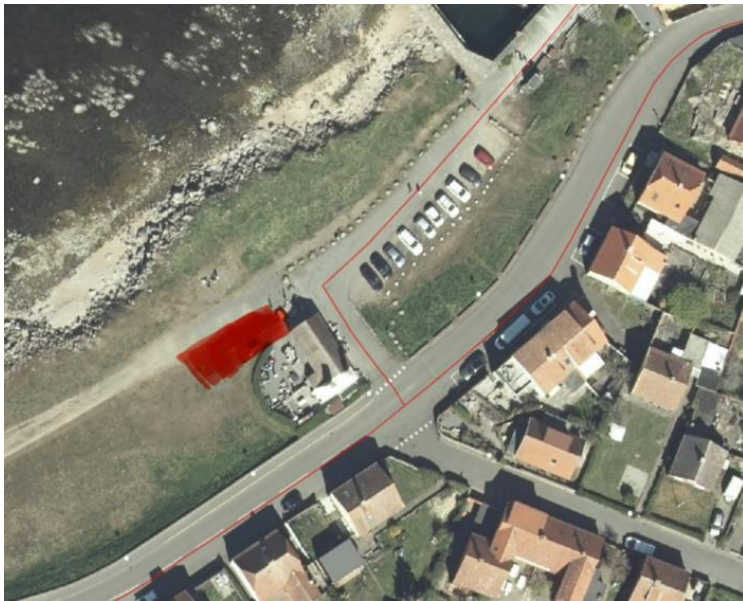
Fig. 3. Nærmere ortofoto indsendt af ansøger hvorpå placeringen af det ansøgte telt er markeret med rødt.

En mindre del af den ansøgte matrikel er beliggende inden for et fredet areal, hvorfor nærværende afgørelse videregives til Fredningsnævnet for Bornholm til orientering.