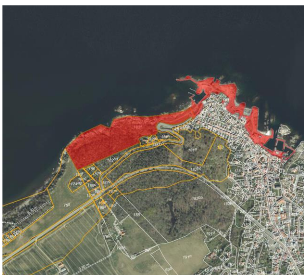
Fig. 1. Ortofoto fra foråret 2025. Den orange linje markerer strandbeskyttelseslinjen og det prikkede, orange område markerer det strandbeskyttede areal. Det strandbeskyttede areal er markeret med orange signatur. De hvide streger markerer de vejledende matrikelskel. Den ansøgte matrikel er markeret med rød.

På arealet lige uden for vores café på Nørresand 10 (som tidligere var p-plads), ønsker vi at opstille et telt i forbindelse med fejring af virksomhedens 10 år og vores sølvbryllup. Det drejer sig om den 29. og 30. august 2026. Teltet er primært en sikring mod det altid uforudsigelige vejr. Bornholms Regionskommune har sagt ja til vores ønske og givet fuldmagt til at vi kan søge. Se vedhæftede mails. Teltet tænkes placeret lige nord for hækken på grusarealet. Vi håber på positivt tilsagn.