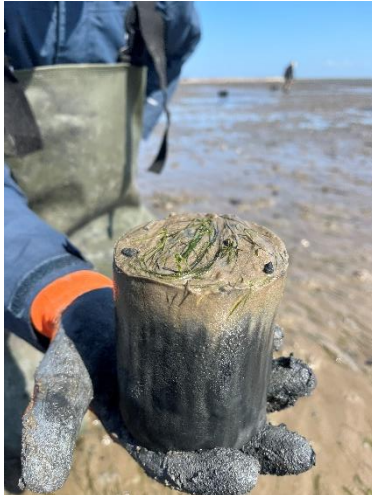
Høstning af zostera noltii ved den Tyske del af Vadehavet (Sylt).