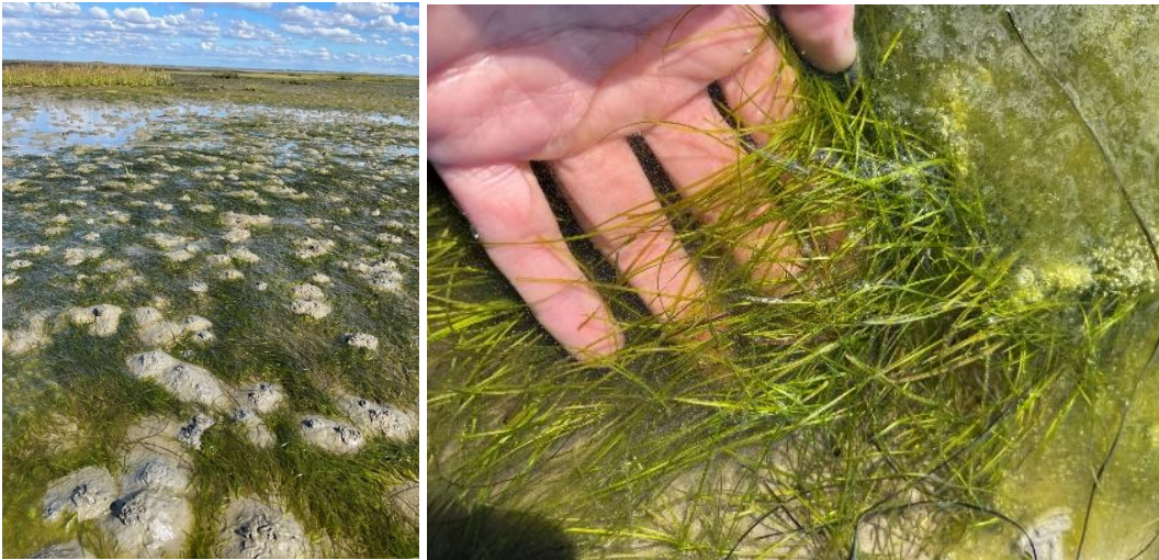
Zostera noltii i den Danske del af Vadehavet (Rømø)

Havgræsser findes mange steder i Danmark, og med en øget viden om de marine græssers betydningsfulde rolle, har ålegræs de seneste år fået forøget opmærksomhed. Ålegræs fungerer bl.a. som bølgebrydere, stabiliserer sedimentet og er et vigtigt habitat for fisk og smådyr.