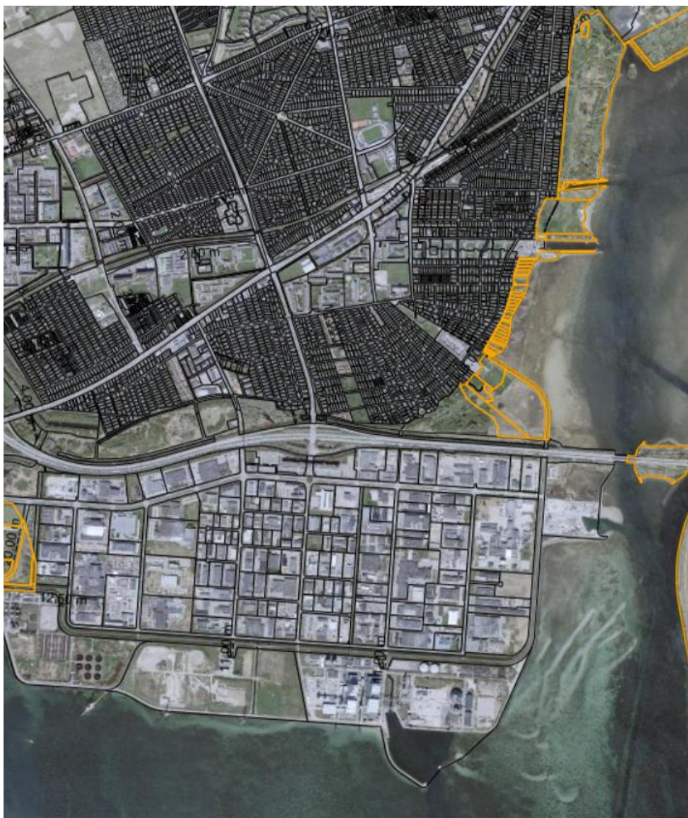
Fig. 1. Ortofoto 2025. Det strandbeskyttede areal er markeret med orange signatur. De sorte streger markerer de vejledende matrikelskel.

Arrangementet afvikles den 31. december 2026 fra kl. 04:00 – 16.00.