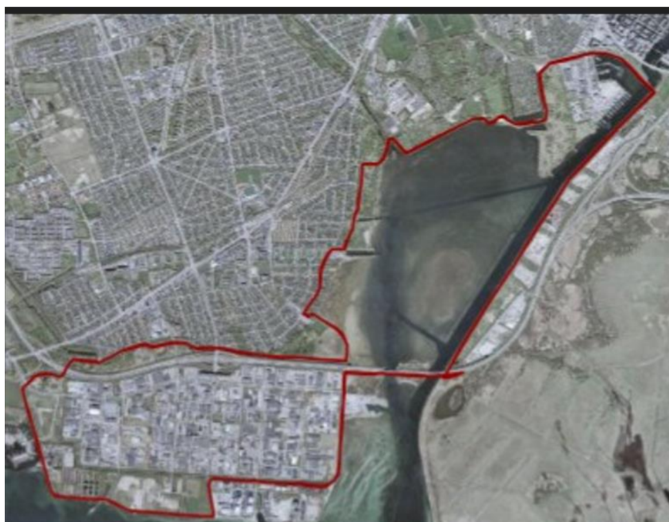
Fig. 3. Kort vedhæftet ansøgningen.

Den ansøgte placering ligger inden for et fredet område. Afgørelsen videresendes af den grund til Fredningsnævnet for København til orientering.