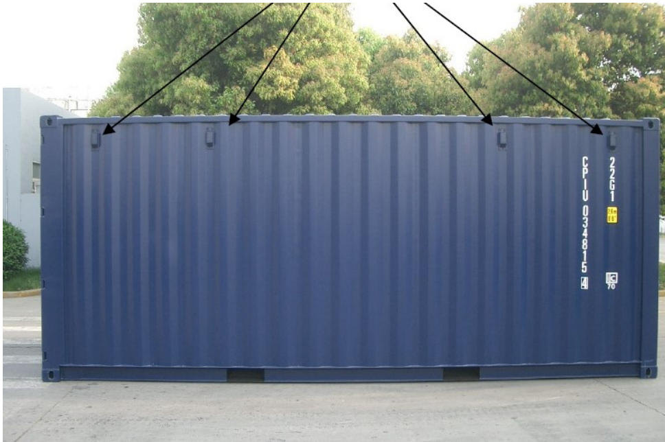
Fra ansøgning, billede af container