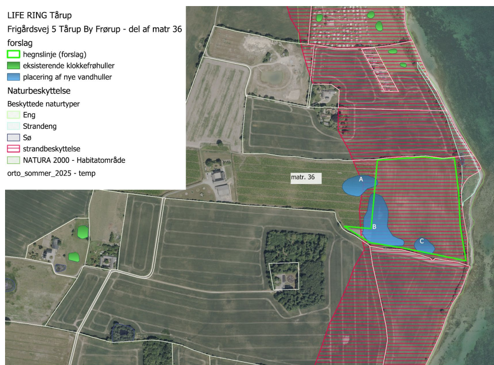
Fig. 1. Ortofoto 2025. Det strandbeskyttede areal er markeret med rød signatur. De hvide streger markerer de vejledende matrikelskel (fra ansøgningen)

Der er tale om en landbrugsejendom, som ligger i landzone, delvist inden for strandbeskyttelseslinjen, og ejes af privat lodsejer, som har givet kommunen fuldmagt til at ansøge om dispensation. Af de to ansøgte søer ligger den ene (A) delvist og de to (B og C) i deres helhed inden for strandbeskyttelseslinjen. Se figur 1.