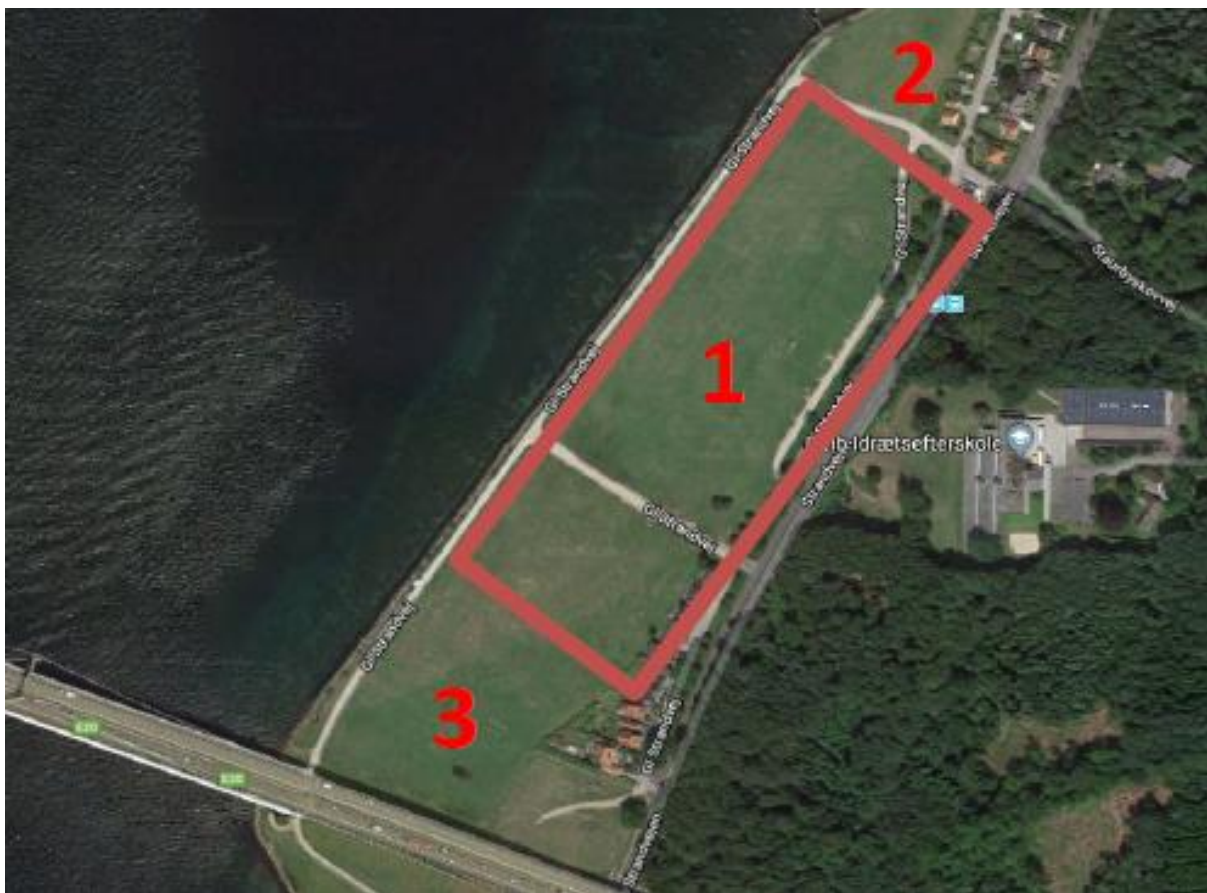
Fig. 2. Tilsendt fra ansøger. På figuren er anvendelsen af matriklen angivet. 1) markerer udstillingsområdet, 2) markerer udstiller parkering og 3) markerer gæste parkering.