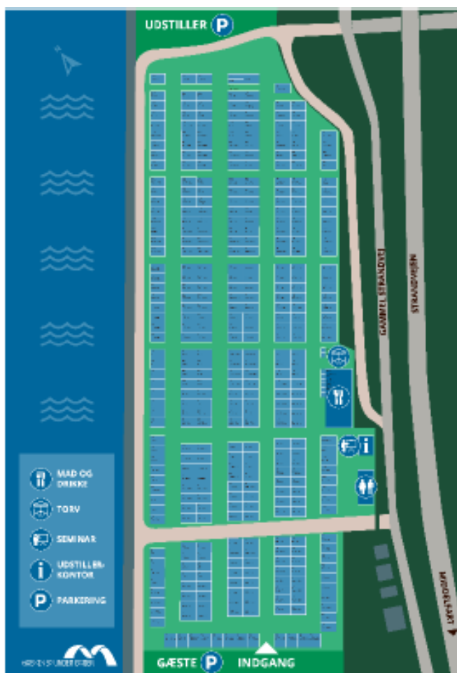
Fig. 3. Tilsendt fra ansøger. På figuren ses en illustration af den ansøgte opstilling i forbindelse med arrangementet.