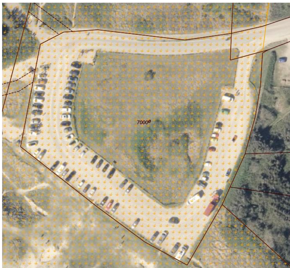
Fig. 1. Fig. 1. Ortofoto 2025. Kort over parkeringsplads. Det orange prikkede område markerer det klitfredet areal. De sorte streger markerer de vejledende matrikelskel. Matriklen er i sin helhed omfattet af klitfredning.

Til ansøgningen blev der den 9. april 2025 meddelt dispensation 3 på visse vilkår.