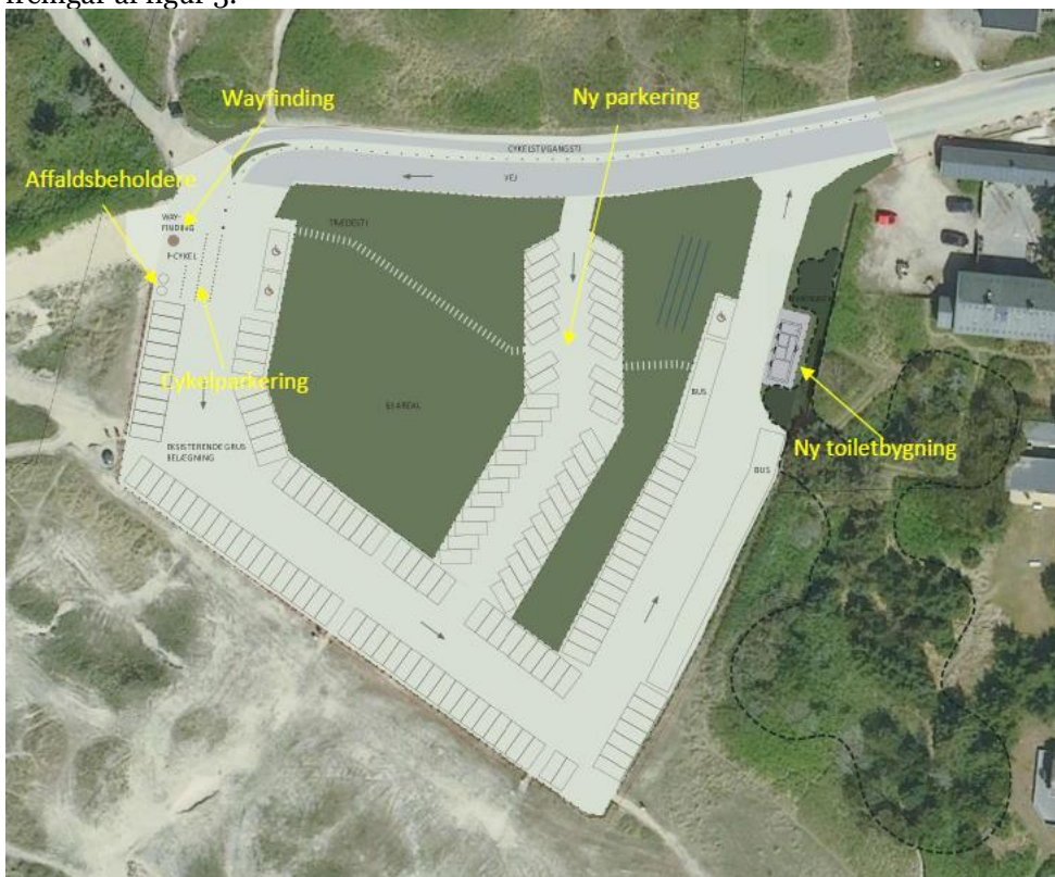
Fig. 2. Forslag B, som er godkendt med den oprindelige dispensation.

Nedenfor fremgår det oprindelige projektforslag af figur 2. Det tilrettede forslag fremgår af figur 3.