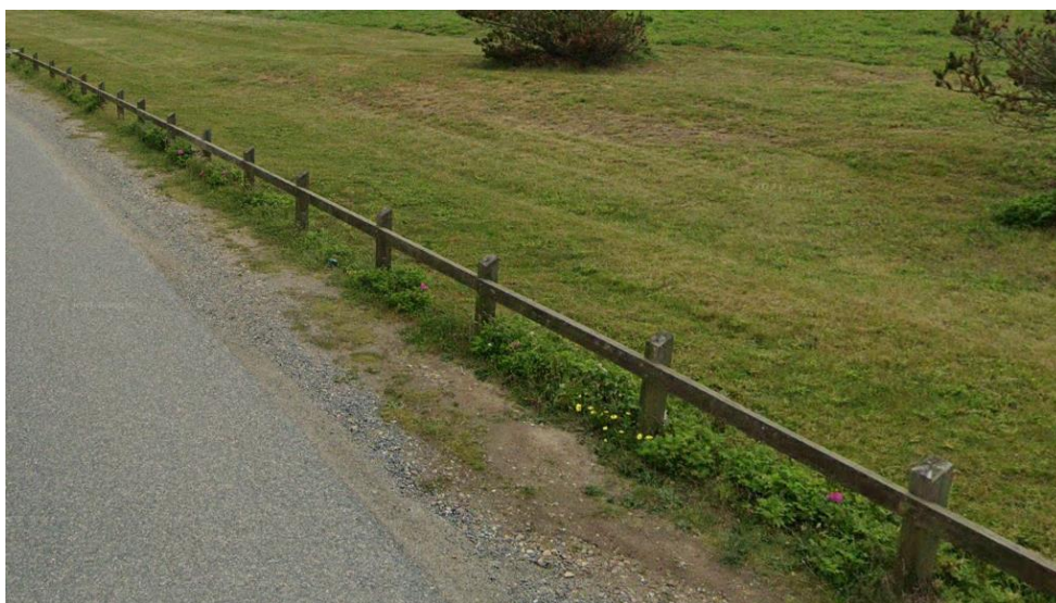
Fig. 4. Fodhegn som oprindelig dispenseret.

Der blev i afgørelsen af 9. april 2025 dispenseret til et fodhegn på arealet af typen som ses nedenfor af fig. 4.