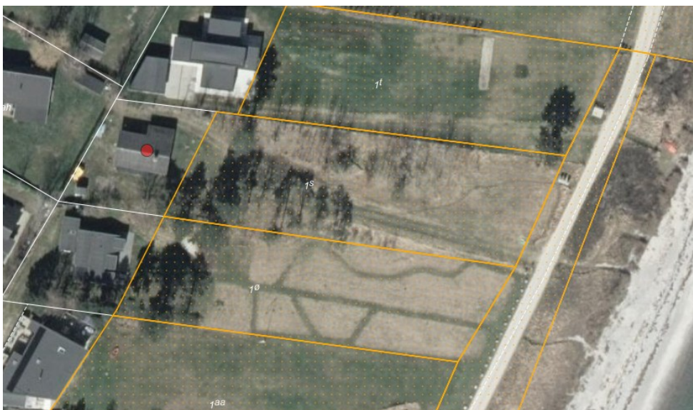
Figur 1. Ortofoto 2025. Den røde prik markerer matrikel 1s Elsegårde, Ebeltoft Jorder. Det strandbeskyttede areal er markeret med orange signatur (de umatrikulerede arealer ud til kysten er dog også omfattet af bestemmelserne om strandbeskyttelse). De hvide streger markerer de vejledende matrikelskel.

Sandmile hæves 80 cm over terrænet, da dette er nødvendigt pga. vandspejlet. Derudover etableres der en bundfældningstank med to dæksler. Dækslerne vil være beliggende i terræn.