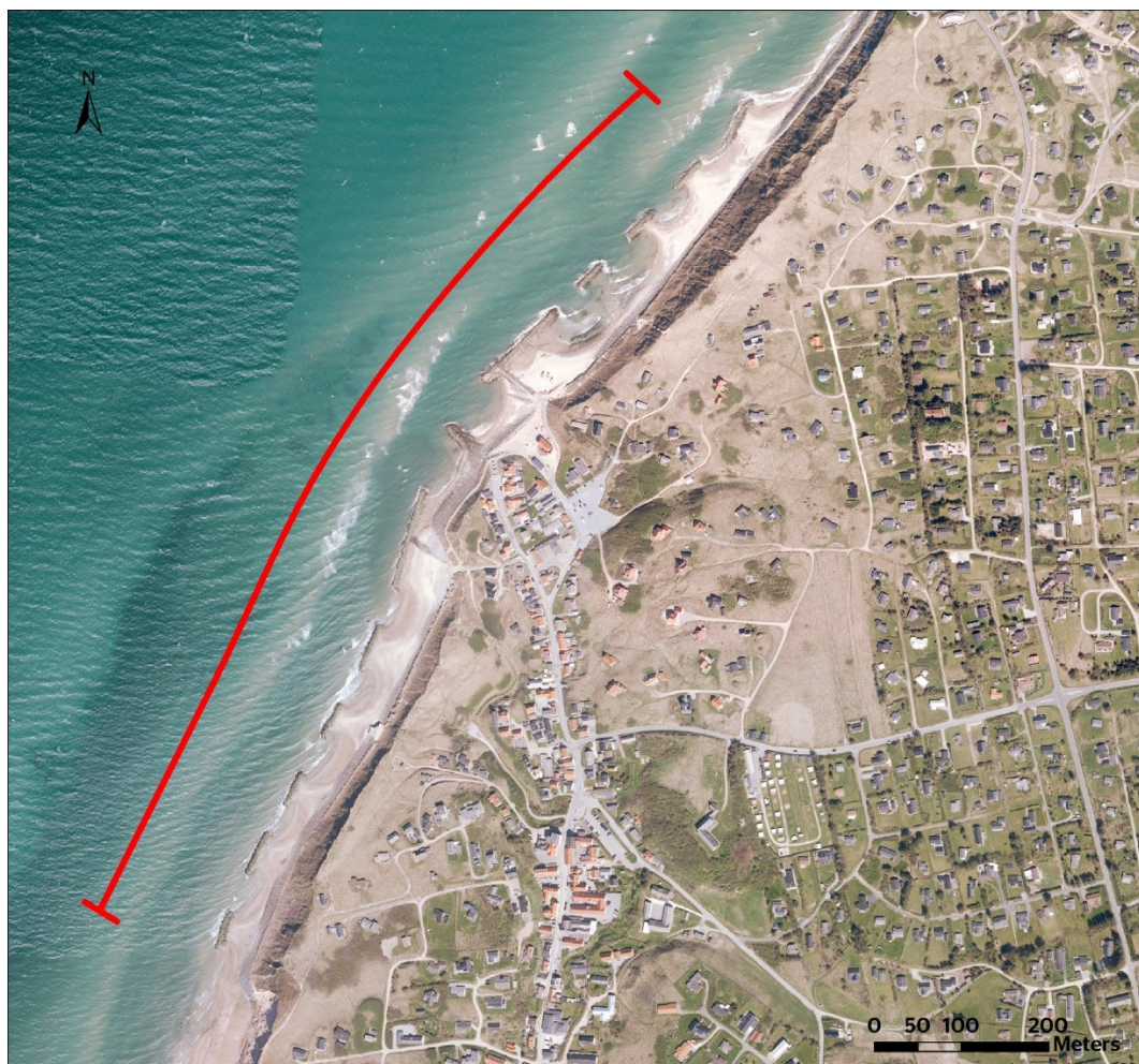
Figur 1– Kystbeskyttelsens geografiske afgrænsning.