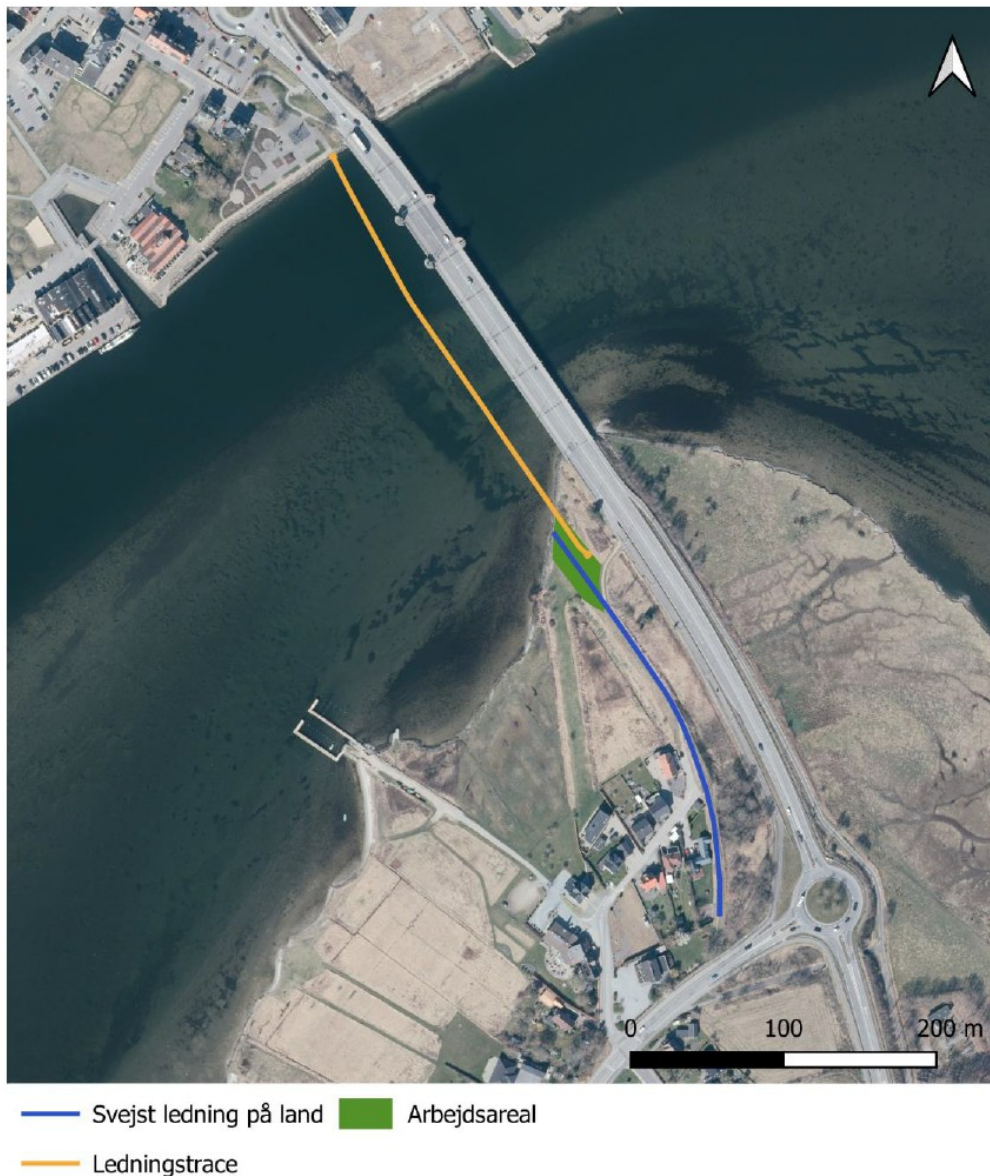
Fig. 2. Oversigt over det ansøgte projekt, indsendt af ansøger.

Hertil vedlagde ansøger en oversigt over det ansøgte projekt, se fig. 2. Bemærk at nærværende afgørelse udelukkende omhandler arbejdet der foretages på land, inden for strandbeskyttelseslinjen.