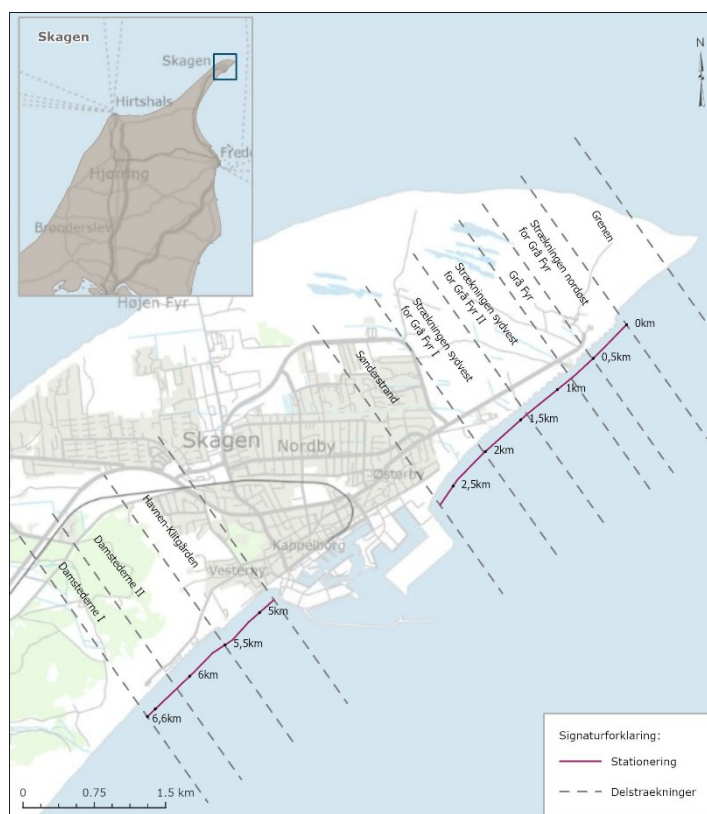
Figur 1 – Kystbeskyttelsens geografiske afgrænsning.

Planen sætter udelukkende overordnede rammer for kystbeskyttelsen, og detaljer for hvor, hvornår og hvordan kystbeskyttelsen gennemføres, vil blive fastlagt i de konkrete projekter for kystbeskyttelse indenfor planens rammer.