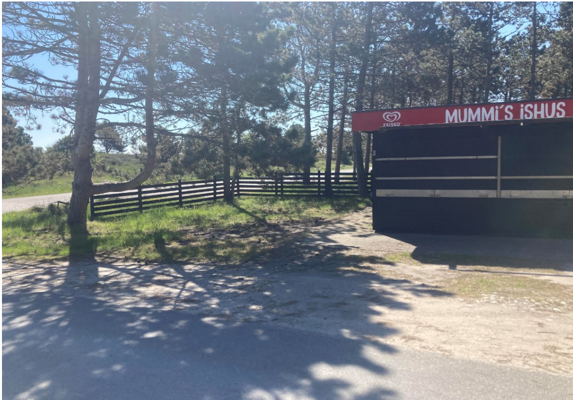
Ishuset set fra nord. Bord, bænkesæt ønskes placeret til venstre på billedet, øst for ishuset.

Arealet er omfattet af fredskovspligt, og denne afgørelse sendes derfor til Miljøstyrelsen til orientering, idet Miljøstyrelsen er myndighed for udpegningen.