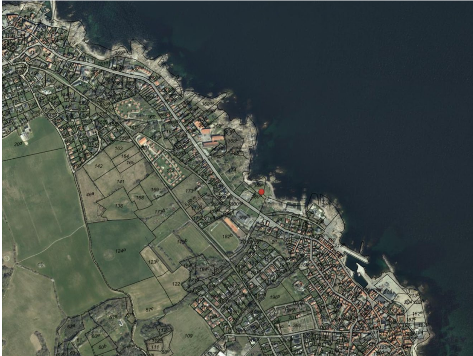
Luftfoto af området. "Cirkuspladsen" er markeret med rød prik.