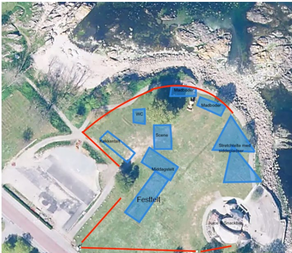
Situationsplan viser opstillingen.

Eventet arrangeres af den lokal foreningen Foreningen Wonderfestiwall