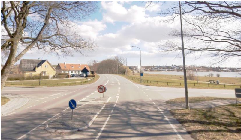
Eksisterede forhold set fra vest