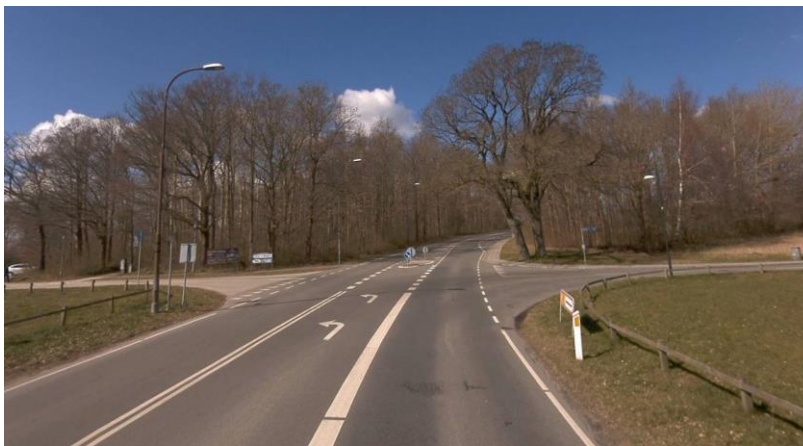
Eksisterede forhold set fra øst